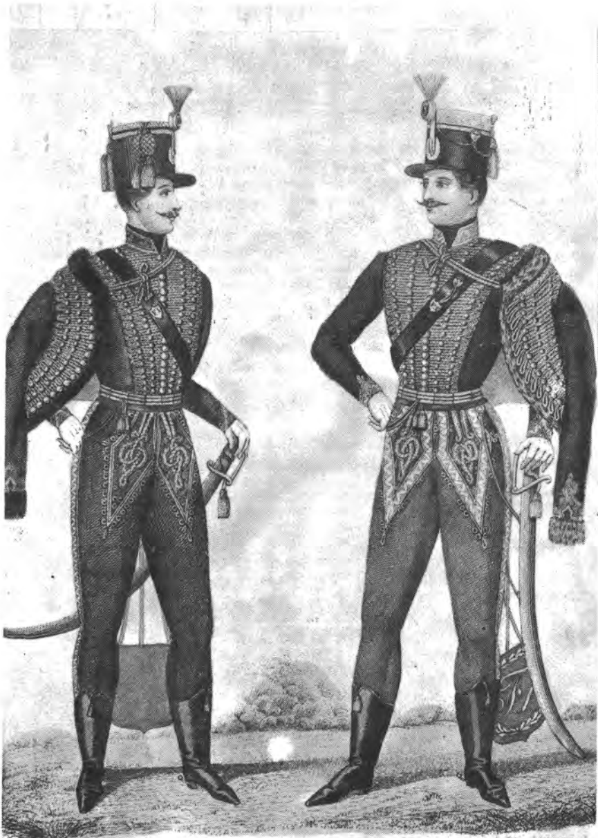
Die 15te Husar magyar Reichs-Roten.