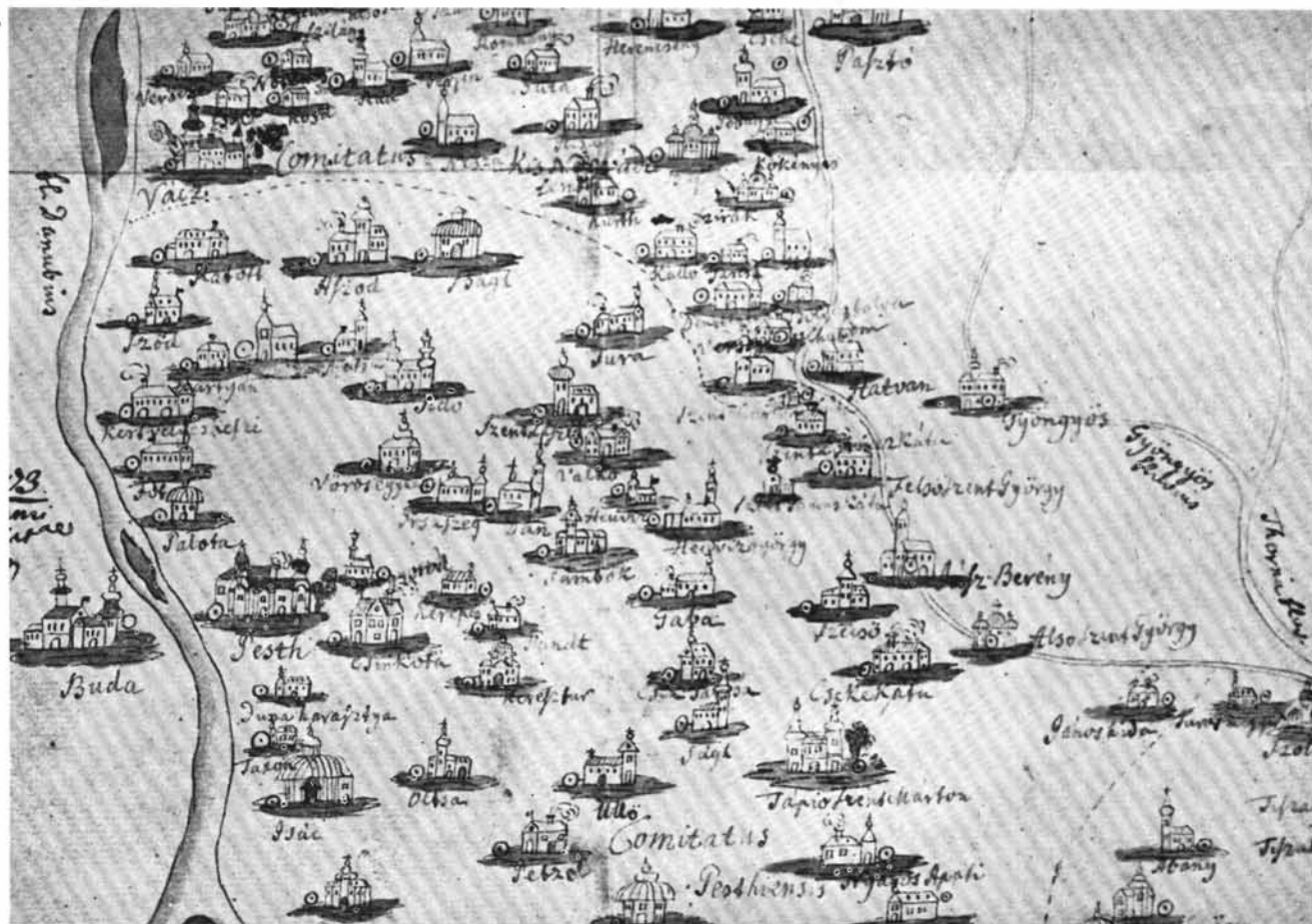
15. Pest környékének templomai egy 1673 körüli térkép 1773. évi másolatán.