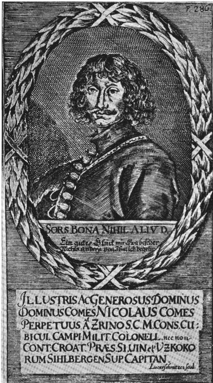
1. Zrínyi Miklós gróf, a költő.