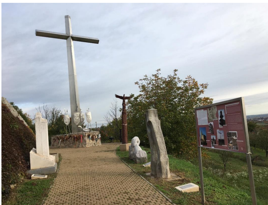
9. ábra: A nagyharsányi szoborpark csataemlékműve

Mindebből világosan látszik, hogy a jellemzően nyugat-európai, 17–19. századi röplapok, irodalmi-, és képzőművészeti alkotások csataelnevezései között a Harsányi-hegy neve jelentkezett, míg a lokális és országos szintű intézményesült emlékezeti elemek főleg a településhez kötődnek, azon belül is a település szakrális-, illetve oktatási intézményeinek a tereiben jelennek meg. A leggrandiózusabb emlékmű a nagyharsányi szoborparkban található (9. ábra). A 2014-ben elkészült emlékhelyen horvát, bajor, osztrák és magyar emlékművek találhatók, együtt alkotva a Harsány-hegyi csata egyetlen magyarországi, nemzetközi emlékhelyét.