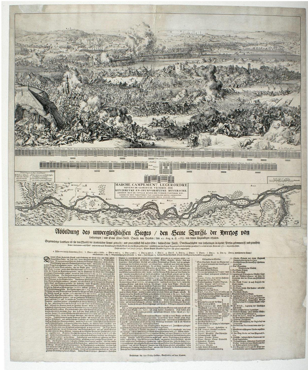
4. ábra: A Harsány-hegyi csata, 1687. Korabeli röplap. (Eredeti cím: Marche, Campement, Legerordre Nevens de Glorieuse Victoire. Der Keyzerlyke. En Churvorstlyke Beyersche Armeen... Den 12 Augusti 1687. Forrás: Országos Széchényi Könyvtár, Régi Nyomatványok Tára 5

röplapok nemcsak egy rövid időtartamú eseményt ábrázoltak, hanem egy egész féléves eseménysorozatról adtak hírt (4. ábra) (Etényi N. 2003).