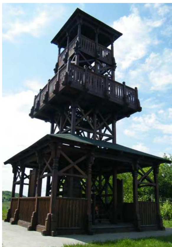
10. ábra: a villányi Csatatéri-kilátó

próbálták meg a török szpáhik a császári csapatok hátába kerülni. Továbbá, a vitatott Kistótfalu helye is a mai Villány területén helyezkedhetett el (Veress D. Cs. 1989). Vélhetően ez is közrejátszott abban, hogy éppen ezen a helyen került sor a Csatatéri-kilátó (10. ábra) 2011-es felállítására. Egy helyi látványosságokat népszerűsítő weboldal 14 szerint az egykori csatateret is megtekinthetik azok, akik a torony csúcsába felmásznak. Ennélfogva joggal merülhet fel a kérdés, hogy elsősorban a térség turizmusának fellendítése vagy az emlékeztetés volt-e a kilátó megépítésének fő motivációja, esetleg mindkét szempont ugyanolyan fontos volt-e.