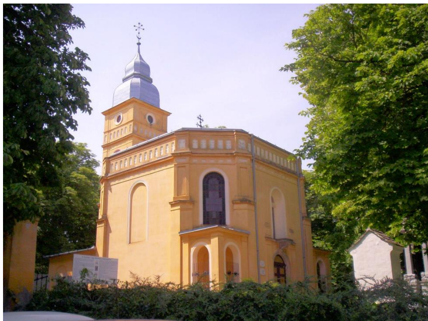
2. ábra: a mohácsi Csataférfi Emlékkápolna