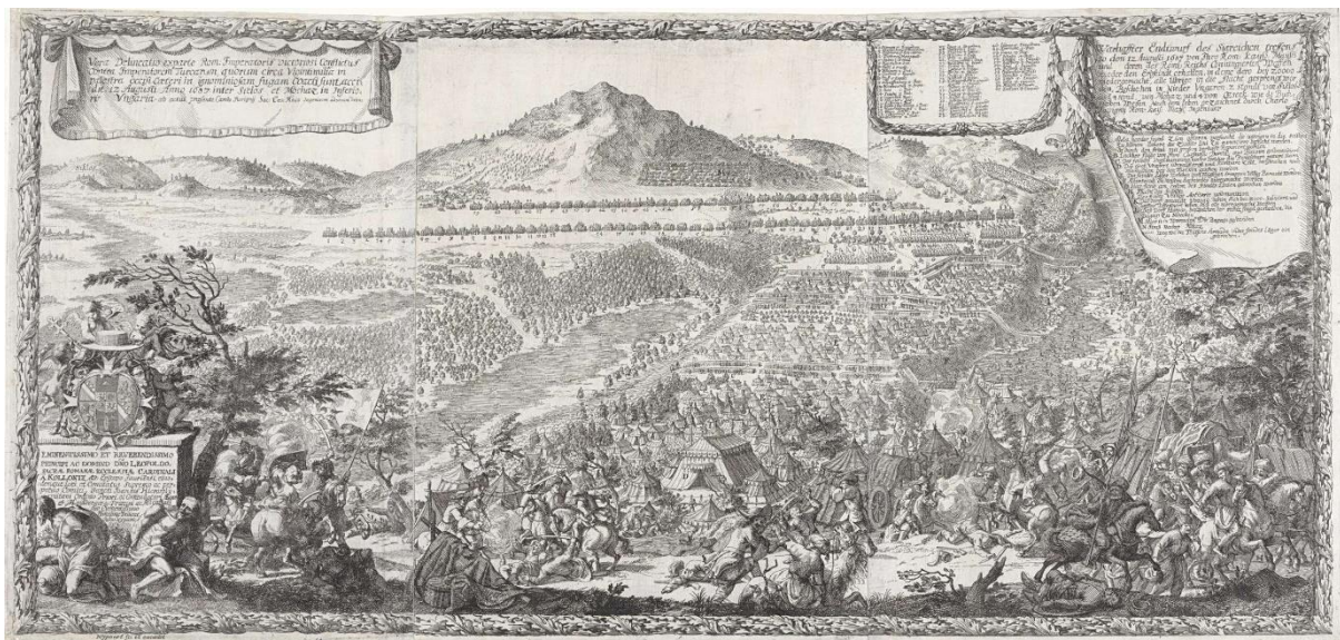
7. ábra: Justus van den Nijport, after Carlo Fuvigny, 1687–1689: Slag bij Mohacz in 1687 8

A csata Mohács és Siklós közti lezajlását örökíti meg Justus van den Nijport is (7. ábra). Művének leírásában pontosan a két település közti területet határozta meg a csata helyeül: „...iz Augusti Anno 1687 infer Siclos et Mohacz in inferio Ungaria”.