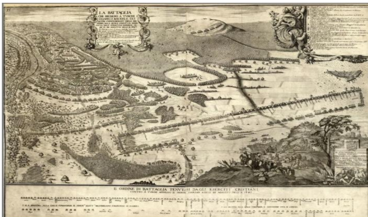
1. ábra: Michael Wening: A nagyharsányi csata (17. század) 2

véglegesen Habsburg fennhatóság alá került. (Veress D. Cs. 1987; Polgár B. 2020a; Domokos Gy. 2020).