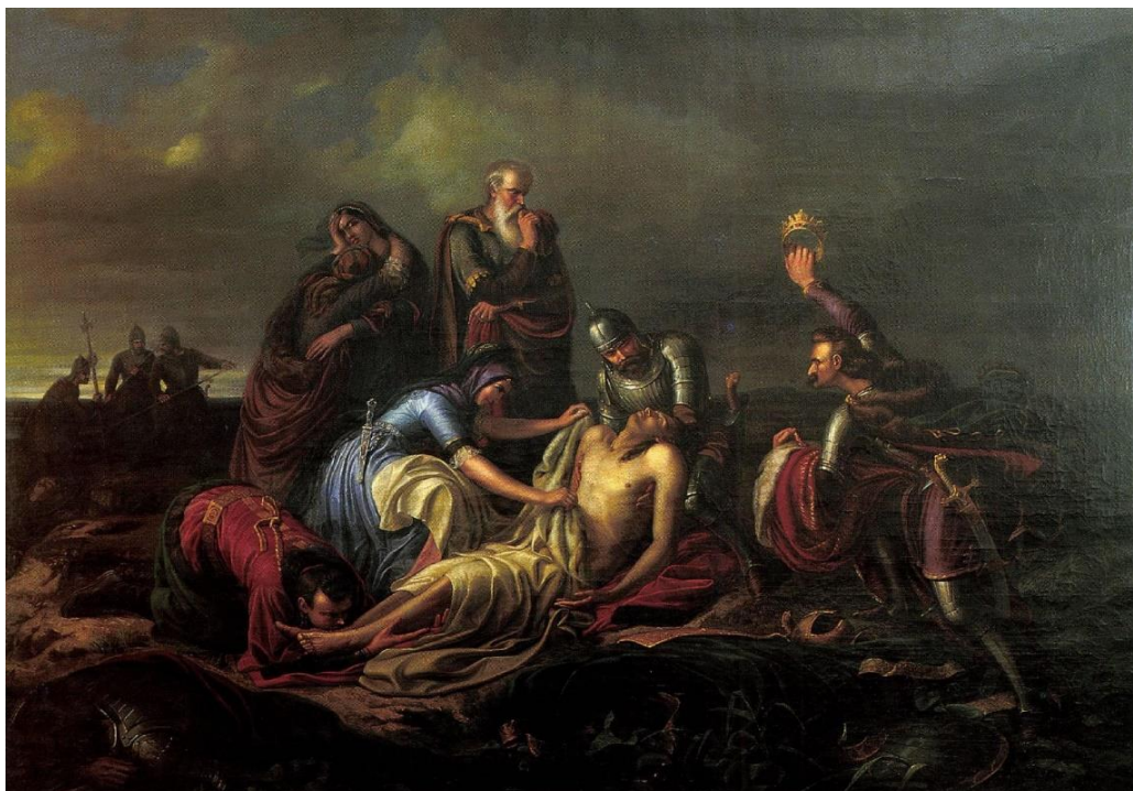
3. ábra: Orlai Petrich Soma: II. Lajos holttestének megtalálása (1851) 4