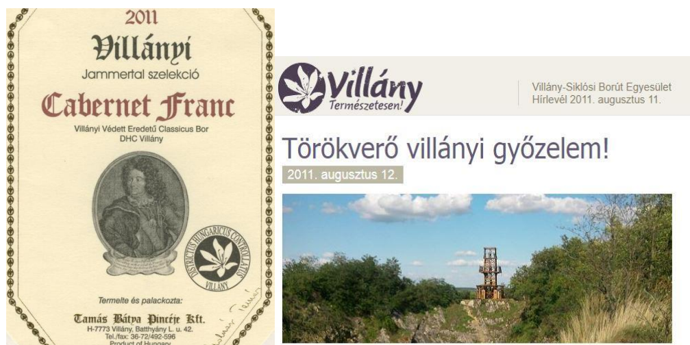
13. ábra: Villars tábormok portréja egy borosüveg címkéjén balra (Polgár Balázs fotója) és a „villányi” győzelem emléknapijának hirdetése 2011-ből (jobbra). Forrás: Polgár Balázs fotója és villanyborvidek.hu 14

A harsány-hegyi csata emlékezete egyes esetekben a villányi borvidék termékeiről is visszatükröződik. Ilyen például a Tamás Bátya Pincéje Kft. által termelt és palackozott Cabernet franc, amelynek Jammertal szekciójából származó palackjain felfedezhetjük Claude-Louis-Hector de Villars 13 portréját (13. ábra).