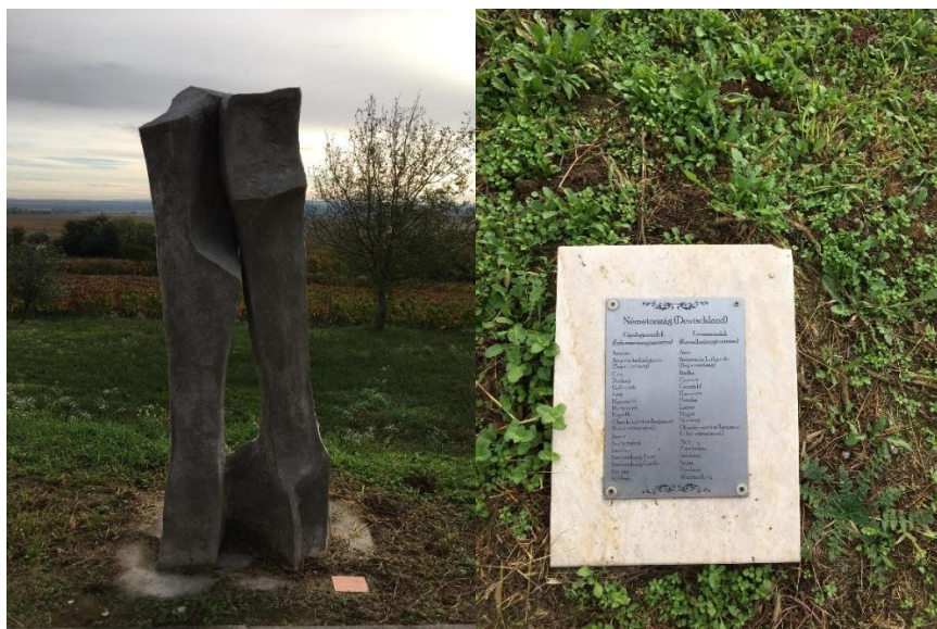
10. ábra: A német szobor és emléktábla.