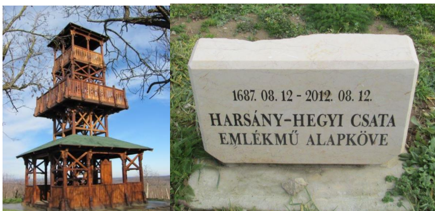
6. ábra: A villányi Csatatér-kilátó (balra) és a harsány-hegyi csata emlékmű alapköve (jobbra). 8

2011-ben villányi Templom-hegyen a Csatatér-kilátó is megnyitására került (Polgár B. 2019). A kilátó megépítéséhez a Duna-Dráva Nemzeti Park, a Gardon Iparművészeti Bt. és a Harsányi csata Emlékbizottsága járult hozzá. 9 2012-ben a grandiózus Harsány-hegyi csataemlékmű alapkövetelére is sor került (6. ábra), amelyet hamarosan, 2014-ben az elkészült emlékmű átadása követett (Polgár B. 2019).