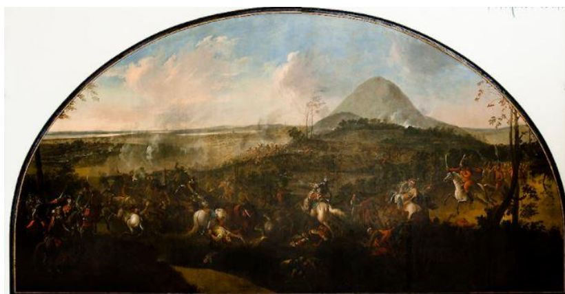
4. ábra: A mohácsi emlékkápolnában található Dorfmeister-olajfestmény az 1687-es második mohácsi csatáról.