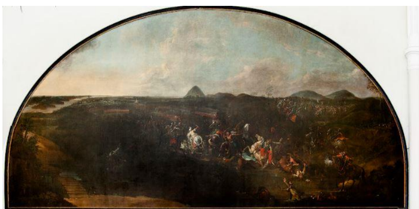
3. ábra: A mohácsi emlékkápolnában található Dorfmeister-olajfestmény az 1526-os mohácsi csatáról. 6