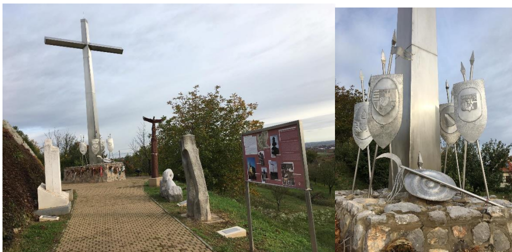
7. ábra: A 2014-ben felavatott emlékmű a Harsány-hegy keleti lejtőjén.

helye is szimbolikus célt szolgál. Magasan, jól láthatóan van kihelyezve, üzenve mindenkinek, aki látja, ez a hely, a keresztény győzelem helye, a keresztény ideológia szimbolikus tere.