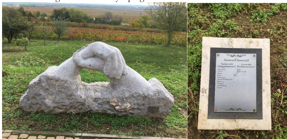
9. ábra: Az osztrák szobor és emléktábla.