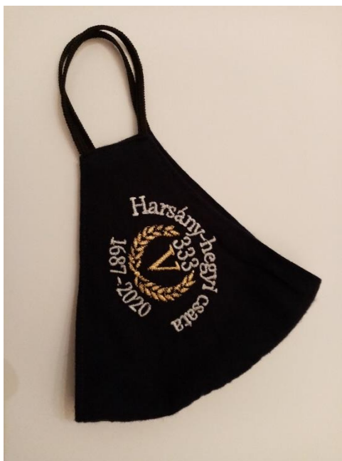
14. ábra: A harsány-hegyi csata emlékét tükröző maszk.