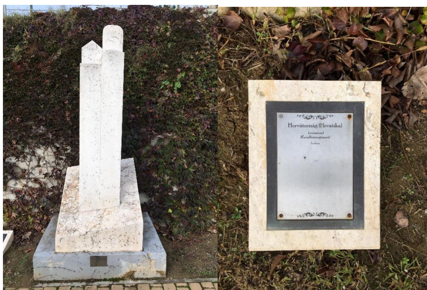
11. ábra: A horvát szobor és emléktábla.

A csata helyi emlékezetét erősíti az évente megrendezésre kerülő tematikus vetélkedő, melyet a helyi diákoknak szervez a falu pedagógus közössége. 2012. június 7-én, a csata 325. évfordulója alkalmából került megrendezésre a Harsány-hegyi Csata Emlékbizottság által kezdeményezett első történelmi vetélkedő, amelyen a környék iskoláinak tanulói vehettek részt. 2012-ben a Pécsi Református Kollégium Nagyarsányi Általános Iskolája és az Alapfokú Oktatási és Nevelési Központ Villány általános iskolás, 6. osztályos tanulói mérték össze tudásukat. Előzetes feladatul, a diákoknak a korra jellemző magyar és török katonai öltözetű bábokat kellett készíteniük (12. ábra). A vetélkedő további fordulóiban a tanulóknak történelmi ismereteikről kellett számot adniuk, majd pedig korabeli tárgyakat kellett felismerniük. A versenyben végül Villány csapata jeleskedett a legjobban, így ők kapták meg a harsány-hegyi csata vándorserlegét. Ezen a győztes csapat nevét is feltüntették. A vetélkedőt évente rendezik meg, s az ünnepélyes díjátadóra a harsány-hegyi csata emlékünnepe során került sor. 2015-ben a Pécsi Református Kollégium diákjai remekeltek a legjobban (Erdő J. 2016).