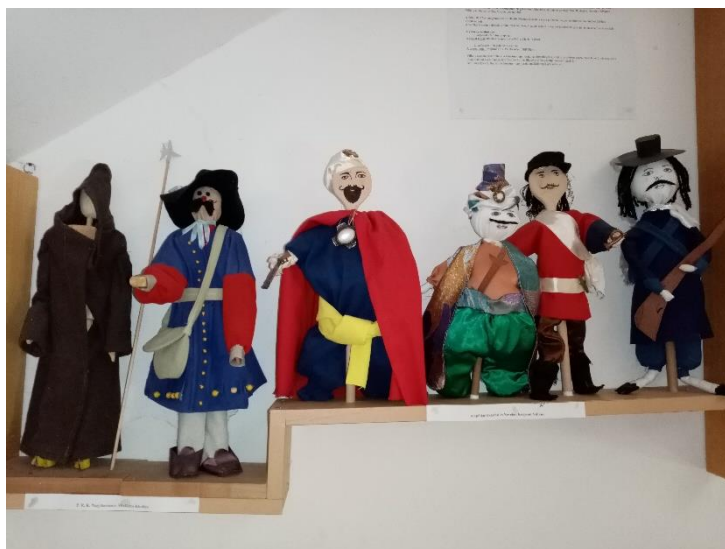
12. ábra: A 2012-es vetélkedőn készült bábok.

A harsány-hegyi csata emlékezete egyes esetekben a villányi borvidék termékeiről is visszatükröződik. Ilyen például a Tamás Bátya Pincéje Kft. által termelt és palackozott Cabernet franc, amelynek Jammertal szekciójából származó palackjain felfedezhetjük Claude-Louis-Hector de Villars 13 portréját (13. ábra).