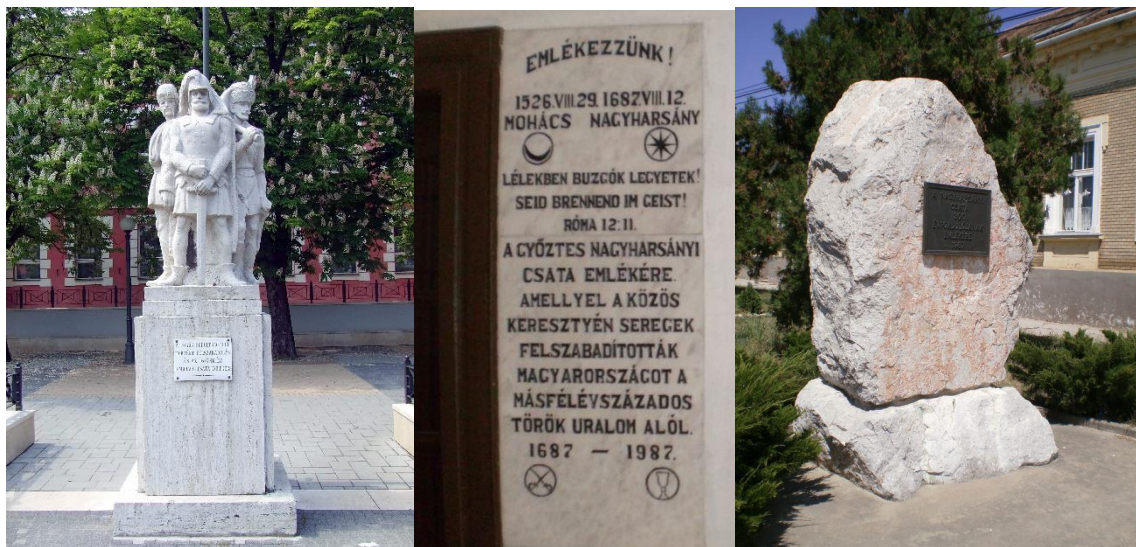
5. ábra: Martinelli Zászlóartók című szobra (balra), a nagyharsányi evangélikus templomban található emléktábla (középen) és a helyi iskola udvarán található kőből faragott emlékmű (jobbra).

ben került sor a nagyharsányi evangélikus templomban elhelyezett márvány emléktábla (5. ábra) elhelyezésére, a csata háromszázadik évfordulója alkalmából (Polgár B. 2016).