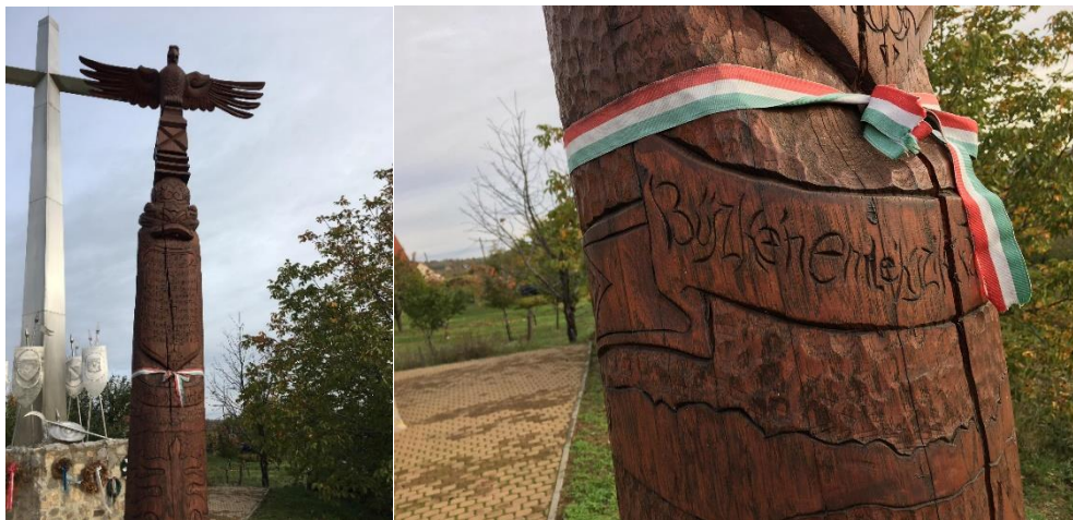
8. ábra: Az emlékhelyen található kopjafa.

A feliratok tanúságot tesznek arról, hogy a harsány-hegyi csata megítélése napjainkban már egyértelműen büszke, nemzeti jelleggel is megtörténhet. A szövegből kitűnik a magyar katonák méltatása is. Azonban, megjegyzendő, hogy az egyesült európai sereg 50.000 főjéből mindössze 7.000 főre tehető a magyar katonák létszáma. Továbbá, az a tény sem hanyagolható el, hogy Thököly Imre vezetése alatt is számos magyar katona teljesített szolgálatot az oszmán seregben, a harsány-hegyi csatában is, a kereszties had ellenében (Nagy L. 1987).