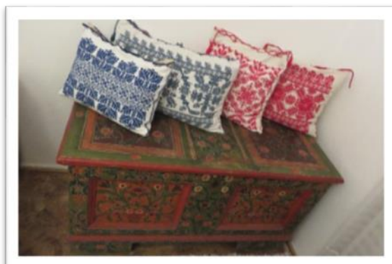
3–4. kép: Magyar jelképek, motívumok