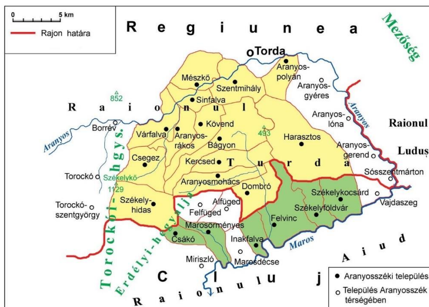
3. ábra: Aranyosszék települései Kolozsvár Tartományban 1952–1968 között