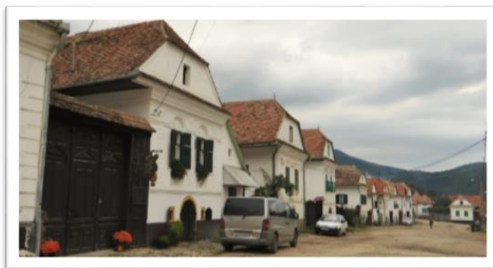
1-2. kép: Hagyományos mesterségek, turizmus