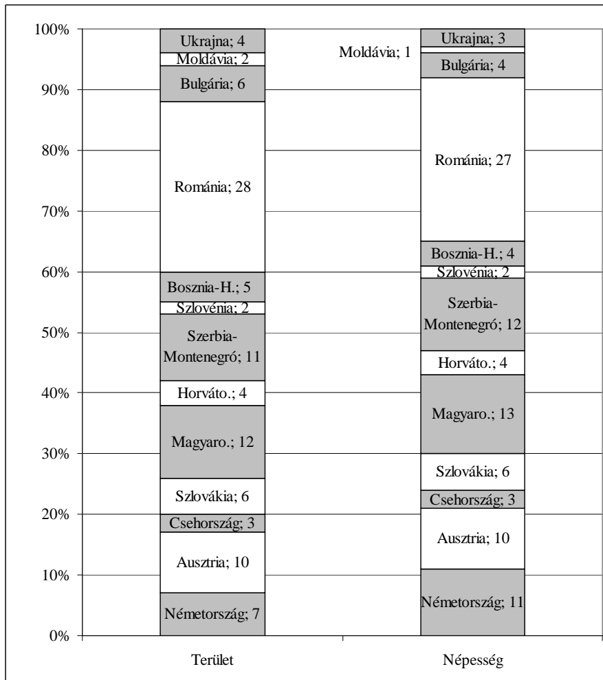
3. ábra: A vízgyűjtő területének és népességének megoszlása az egyes államok között (a kis részesedéssel rendelkező államok nélkül)