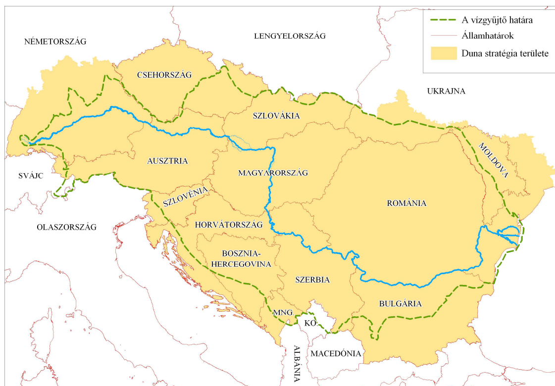
1. ábra: A Duna stratégia területe és a vízgyűjtő viszonya, a vízgyűjtőben érintett államok (MNG= Montenegro; KO= Koszovó) (Szerkesztette: HARDI T.)

többi kifejezés földrajzi tartalma nincs egyértelműen meghatározva, a Duna-medence és Dunatáj fogalma kulturális és politikai tartalmat is hordoz. A vízgyűjtő pontos kiterjedésére több adat is fellelhető. Az ICPDR szerint a Duna esetében ez 801.463 km 2 területet jelent (1. ábra), mintegy 82 millió fős lakossággal, tehát kisebbet, mint a Duna stratégia számára megalkotott „Duna térség”.