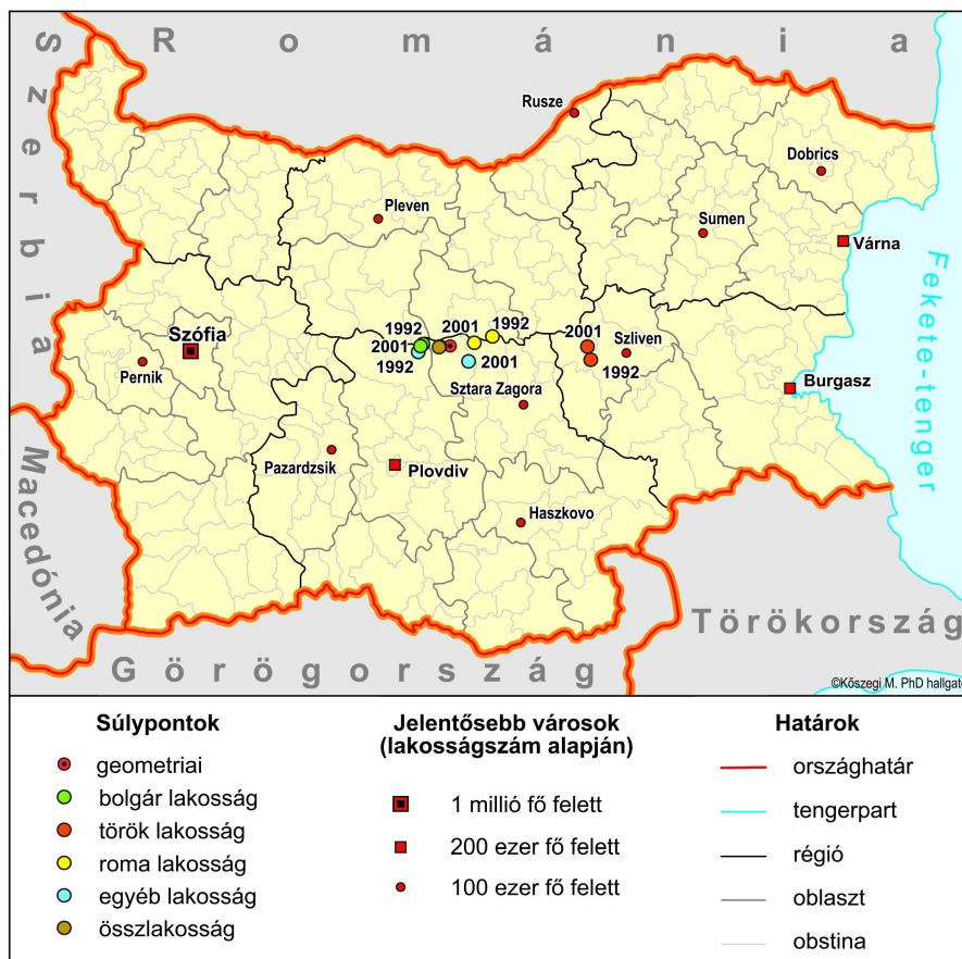
1. ábra: A népesség és az etnikumok súlypontjának változása Bulgáriában (1992-2001).

A legutolsó népszámlálás időpontjában már a válaszolni nem tudók dominanciája határozza meg az egyéb népesség súlypontját, akiknek aránya a Fekete-tenger partjához közeli obstinákban és a nagy kikötővárosok közelében, valamint az ország déli részén jelentős. Ez utóbbi terület a Rodope-hegységben élő pomákok településterületével azonosítható, akik bizonytalan identitástudatukból kifolyólag tetten érhetők az egyéb népesség súlypontjának meghatározásában.