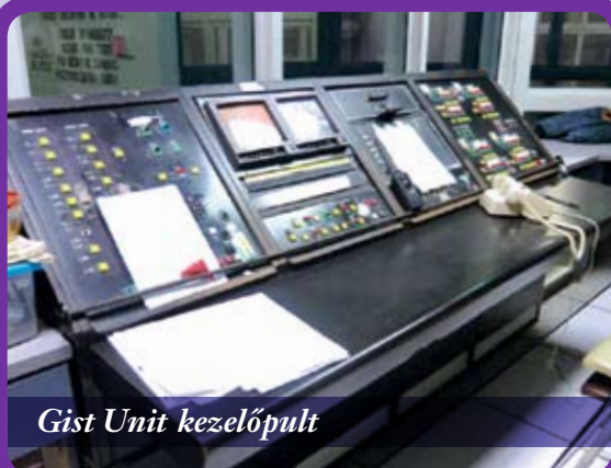
Gist Unit kezelőpult

Ott is dolgoznak a fogvatartottak, de semmiféle munkadíjat nem kapnak. Egy speciális időkreditrendszer, az úgynevezett „good conduct time” működik. Nekem ez azért