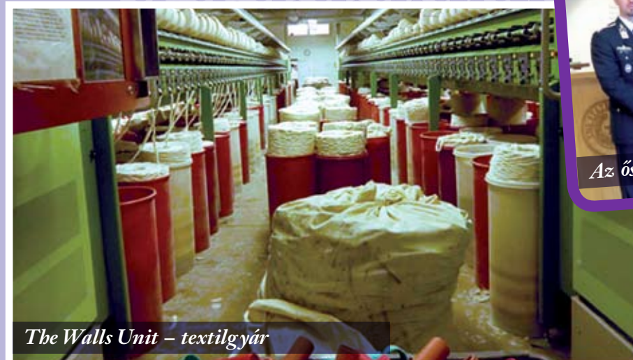
The Walls Unit – textilgyár

perc alatt felszámolták a balesetet. Ki kell emelnem még a Huntsville Unitot, ahol a halálbüntetéseket hajtják végre. Ott jártamkor nem tartózkodott fogvatartott a halálsoron, de azt megtudtam, hogy csak legenda az utolsó kívánság, és a kedvenc ételét sem kapja meg a halálraítélt, csak az utolsó szó jogán szólhat. Azt viszont nem mondták el, hány