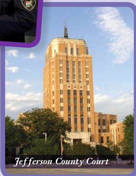
Jefferson County Court

kábítószeres ügyekkel foglalkozó bíróság bírója a texasi Jefferson megyében, emellett pedig a büntetés-végrehajtási szervezet felügyelő testület tagja. Hozzá kell tennem: a magyar tanulmányutat mindenki a saját pénztárcájából fizette, mi, vendéglátók csak a szakmai programot biztosítottuk vendégeink számára. Kint pedig a meghívók állták a költségeimet.