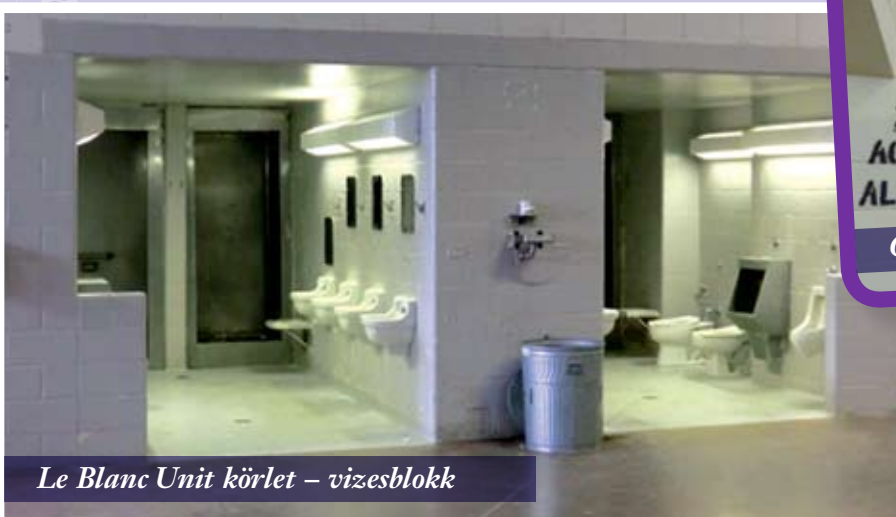
Le Blanc Unit körlet - vizesblokk