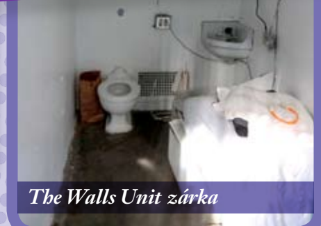
The Walls Unit zárka

összességében azt láttam, hogy a problémáink nagyjából azonosak, hiszen itt is, ott is bűnelkövető emberekkel dolgozunk.