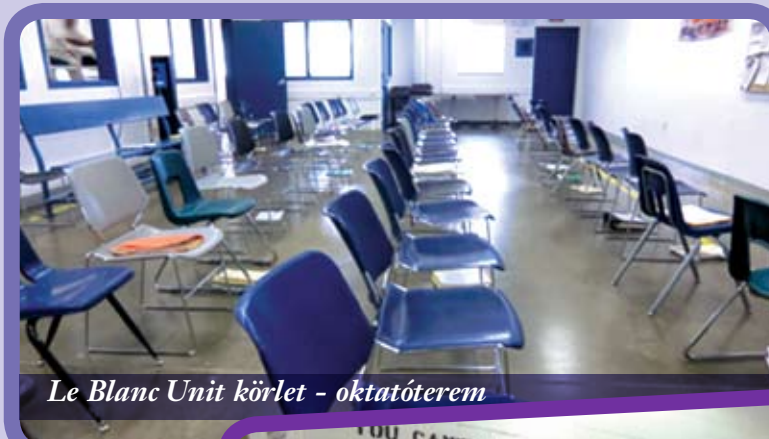
Le Blanc Unit körlet - oktatóterem