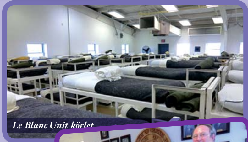
Le Blanc Unit körlet