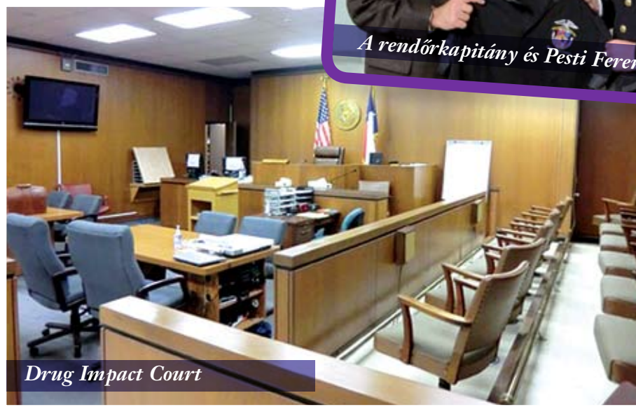
Drug Impact Court