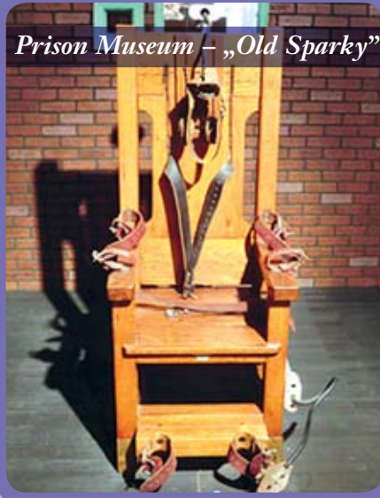
Prison Museum – „Old Sparky”

amit a fogvatartottak nem léphetnek át, sőt egyes börtönökben ezeken a területeken belül hátra tett kézzel kell közlekedniük a fogvatartottaknak.