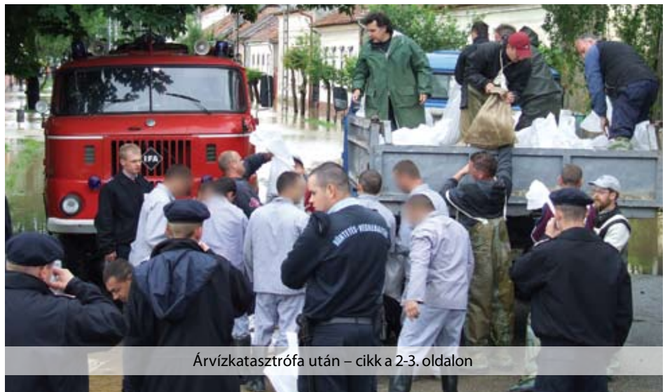
Árvízkatasztrófa után – cikk a 2-3. oldalon

Az előző számunk megjelenése óta eltelt két hónap korántsem volt eseménytelen. A májusban és júniusban folyamatosan ömlő eső okozta árvizek megmozdították az egész országot. Az érintettek nyúlógátat építettek, homokzsákok pakoltak. Akiket elkerült a víz, felajánlásokkal igyekeztek enyhíteni a veszteségeken. Beszéltünk egy felsőzsolcai kollégával, lapzártakor családjával még nem tudott visszaköltözni a házukba. Szervezetünk munkatársai a fogvatartottakkal együtt ott voltak a gátakon, és ott voltak az adományok gyűjtésénél is. Köszönet érte az árvízzel sújtottak nevében.