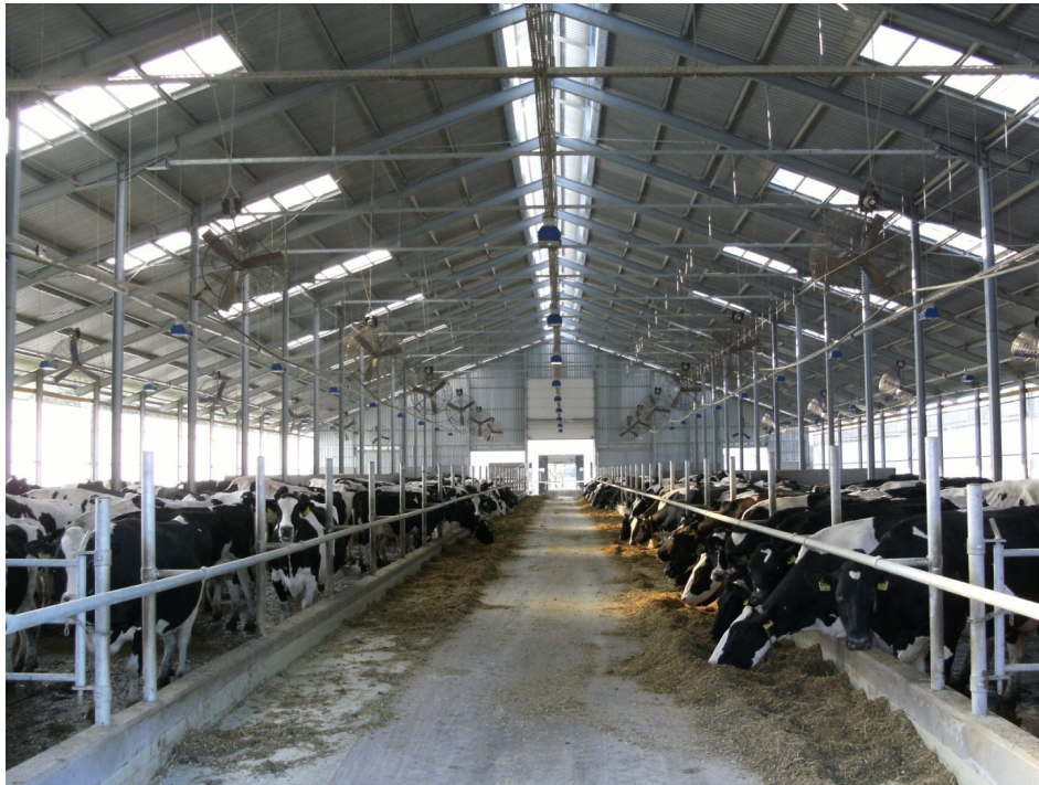
1. kép: A Jászapáti 2000. Mg. Zrt. új építésű istállója

Picture 1: The new-built cow barn at Jászapáti 2000 Mg. Ltd.