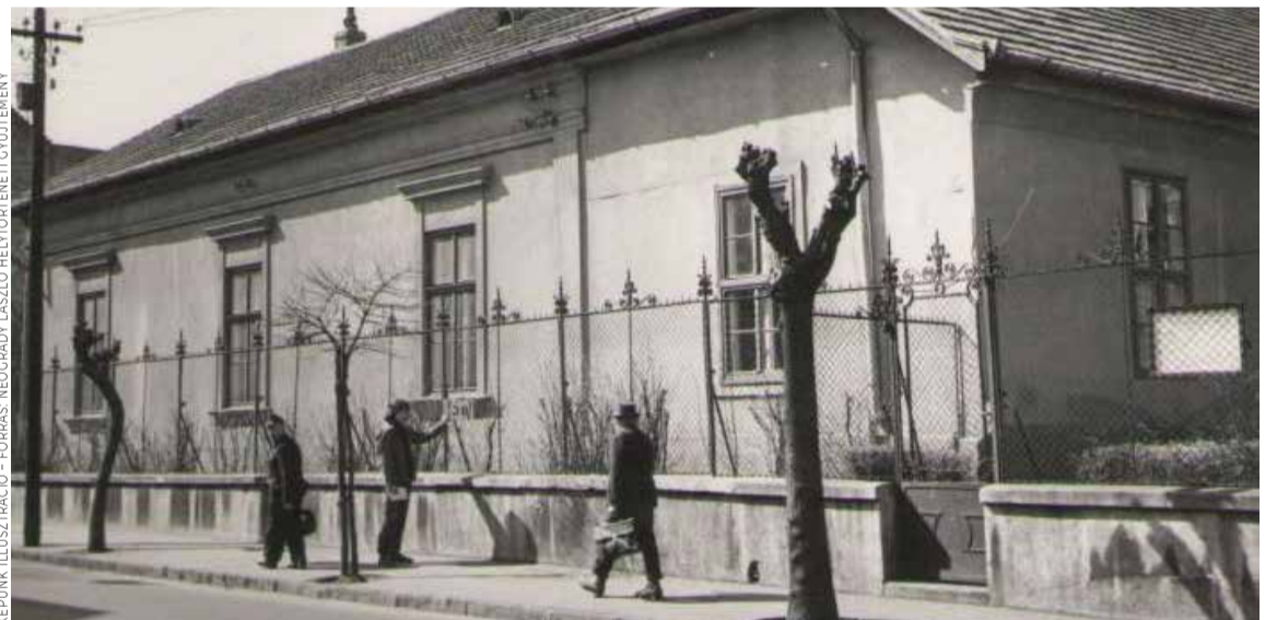
KÉPUNK ILLUSZTRÁCIÓ

De b. nejem nem tudott megülni a fene-kén. Leadtuk a tanácsnak 600 ezer forintért a lakást (két év múlva került csak magántulajdonba, egy vagyont ért volna), és vetünk egy öröklakást a Szent István tér 16-ban. A lakás közvetlenül a régi piacra nyílt.