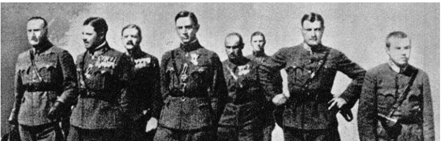
Az Ostenburg-különítmény tagjai