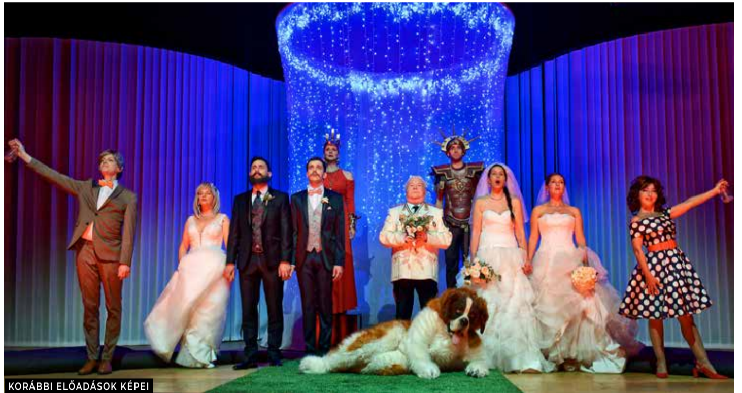
KORÁBBI ELŐADÁSOK KÉPEI