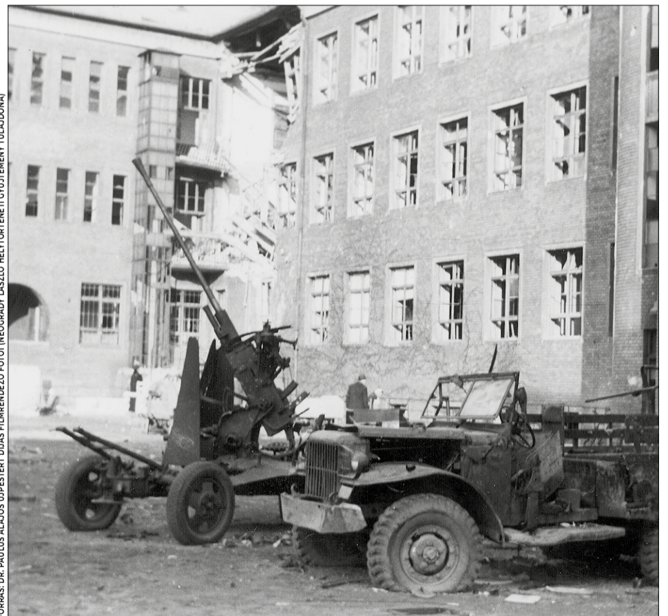
Az újpesti harcok nyoma