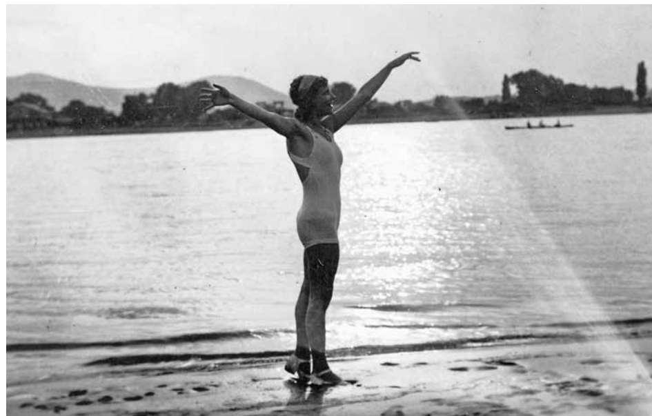
Az újpesti Duna-parton (1930)