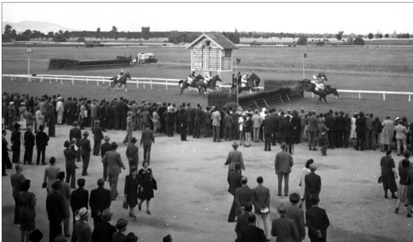
A káposztásmegyeri lóversenypálya 1938-ban

Lóverseny tér, Galopp, Ügető és az egykori Paripa (ma Erdősor) utca – ezek a nevek emlékeztetnek arra, hogy Káposztásmegyeren 1912 és 1944 között népszerű, országos híró lóversenypálya működött. Az egykori, kiváló fekvésű ügető kapcsán a legtöbbször valószínűleg jól öltözött, zsakettes urak, elegáns hölgyek, fess zsokéék és száguldó paripák jutnak eszébe. Joggal. Ilyen volt a létesítmény egyik arca. Most viszont egy némileg más, kissé kalandosabb és véresebb ábrázatát vesszük szemügyre a második világháború utáni, új lakhatási politika áldozatául esett sportlétesítménynek.