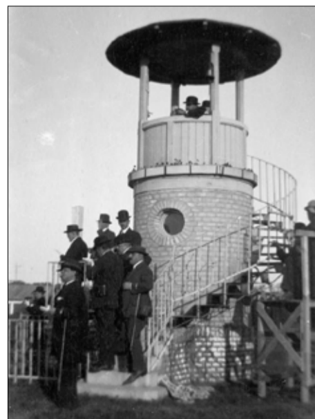
A káposztásmegyeri lóversenypálya célbírói tornya 1924-ben

Vége-hossza nincs azon jegy- és tikkethamisítók listájának, akiket az