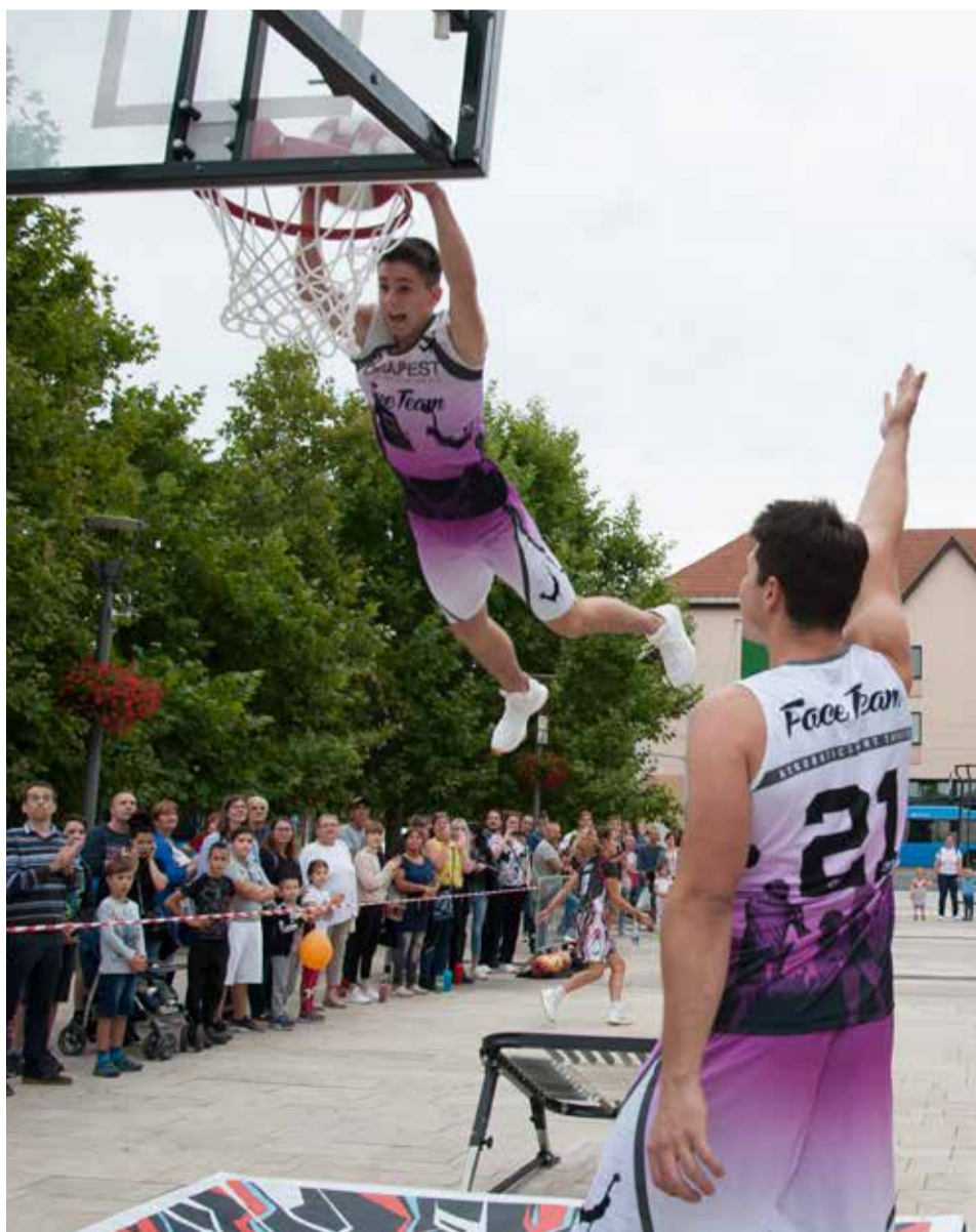
Ugrás! A közönségből is biztosan lett volna jelentkező