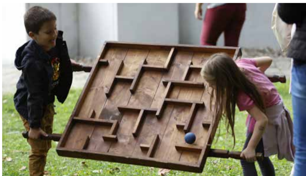
El ne ejtsd, oda a móka! Együttműködés és egymásra utaltság. Az életet tanulják