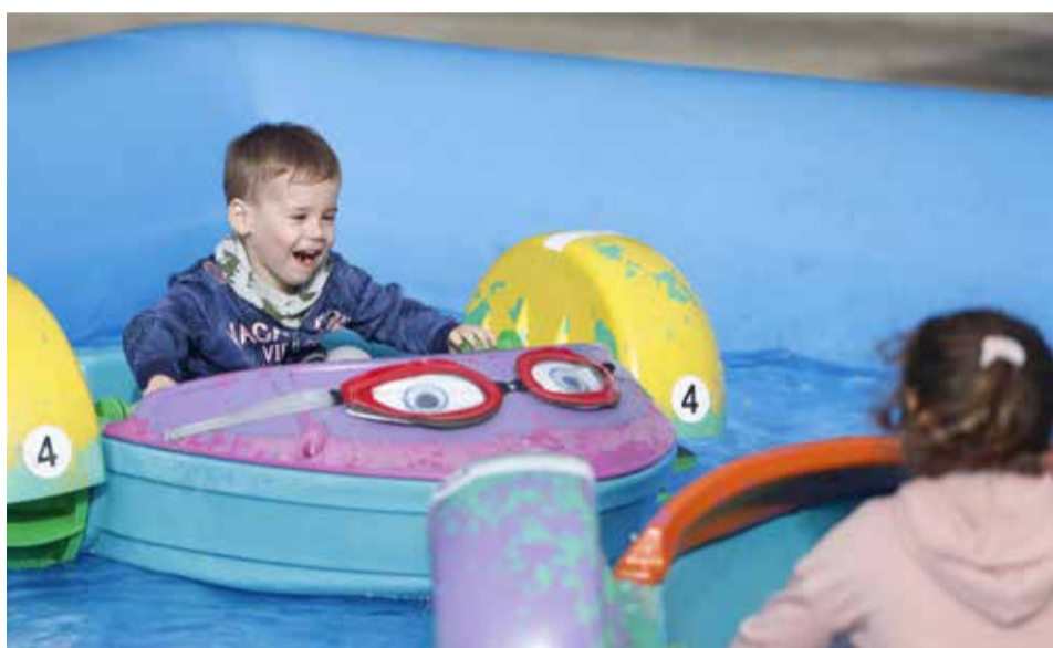
A vízi dodzsemmel egy a baj: nem volt felnőtt méretben

Felpezsdült a város: tavaly a járványhelyzet miatt nem volt rá lehetőség, idén viszont végre újra méltó módon ünnepelhetünk. Az Újpesti Városnapok igazi fesztiválhangulatot varázsolt. Gyerekprogramok, zene és tánc, sport és közösségi események várták a látogatókat. Az őszt pedig koccintással üdvözlöttük, a BorVíkenden legfeljebb csak a szem maradt szárazon, bár talán az sem mindig. Igen, nagyon ránk fért már ez.