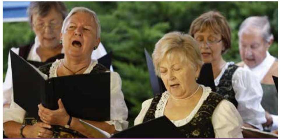
Dalból van a lelkük. Sosincs korhatár