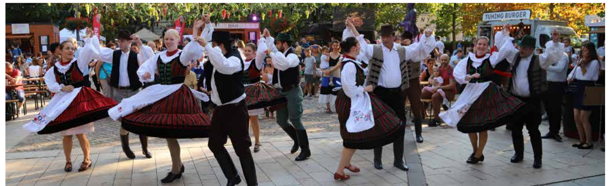
Pörögjön a rakott szoknya, csattanjon a csizma! Nem őrizni kell a hagyományt, hanem megélni