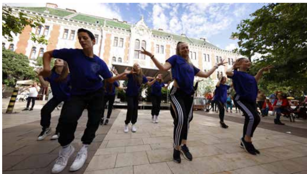
Tánc és sport egyben. Miért nem tornázunk többet a szabadban?