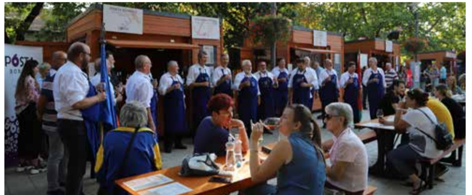
Énekelni a borról, aztán énekelni a bortól