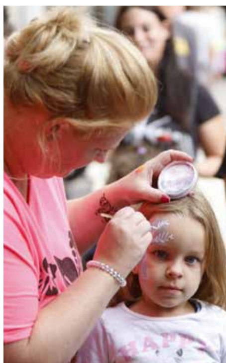
Angyalka lesz belőle vagy pillangó? Mindegy. Mindenképpen tündér