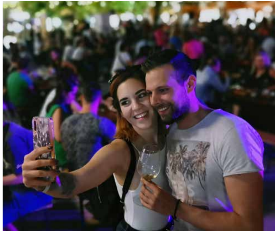
Lesz mit visszaneézni, ez az este már ezen a ponton is tartalmas