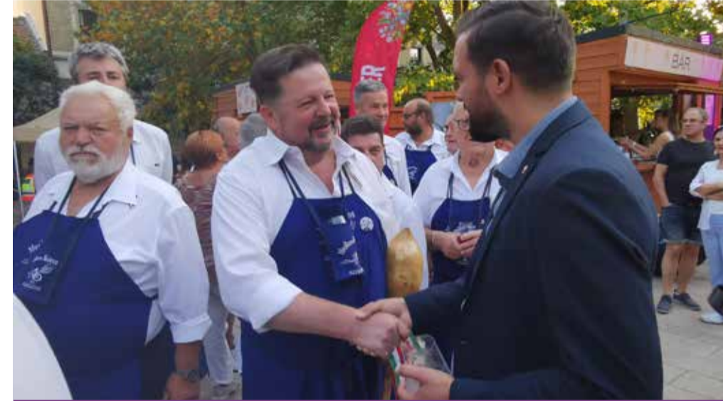
Bor előtt vagy bor után, esetleg két pohár bor között