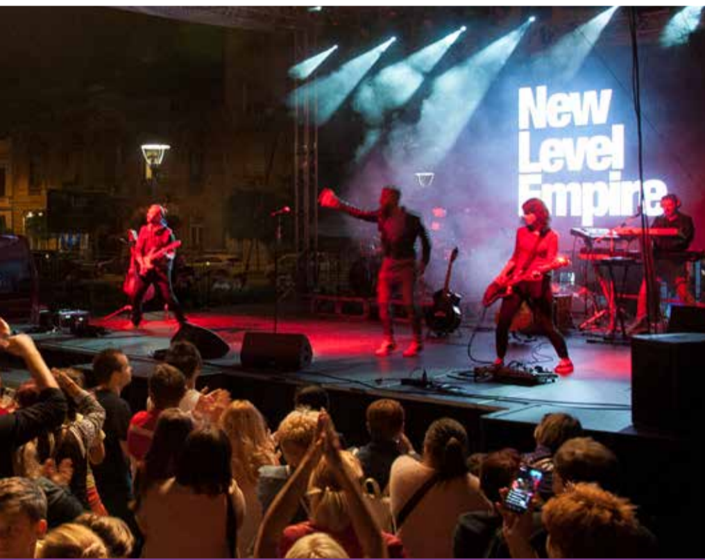
nk. Ezt a mikrofont nem szalvétával fogják