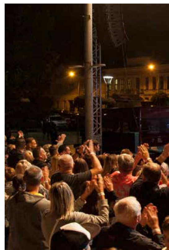
Világot jelentő deszkák, hangerő és st...