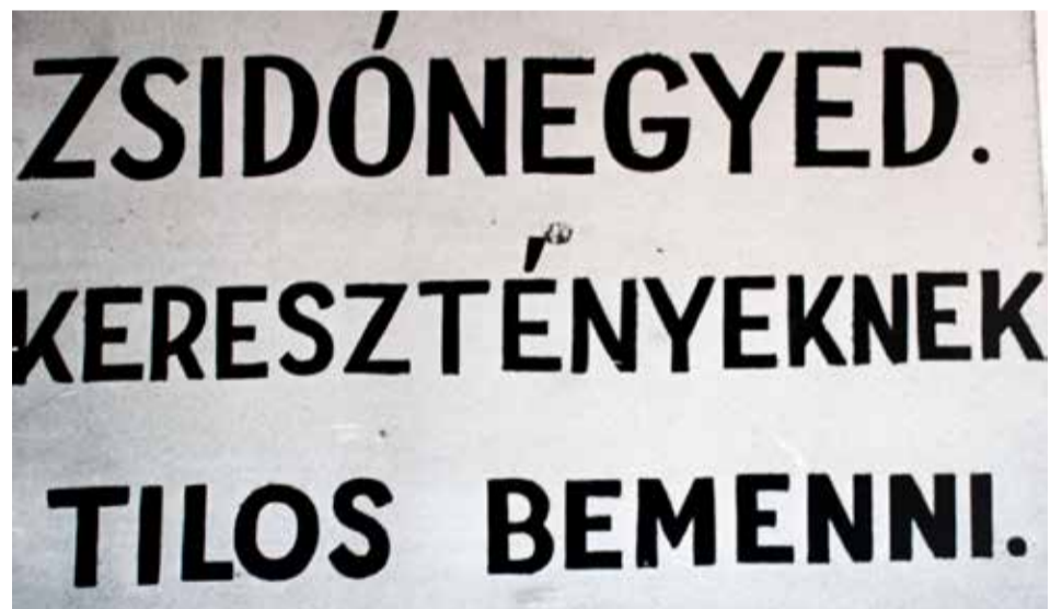
A Sztójay-kormány 1944. áprilisában megkezdte a zsidók elkülönítését