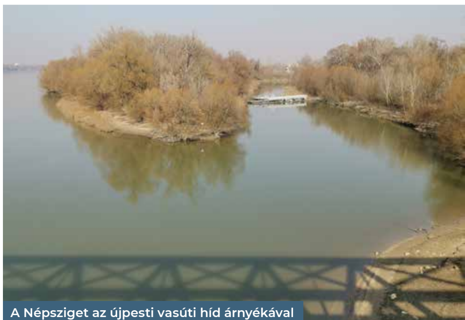
A Népsziget az újpesti vasúti híd árnyékával