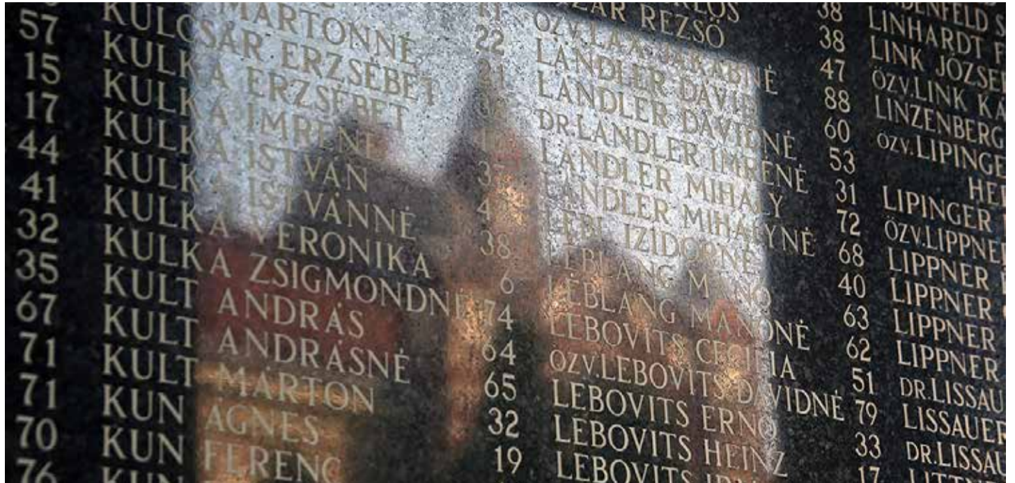
Az emlékfal részlete az újpesti zsinagóga kertjében

Az újpesti zsidókat a németek bevonulása után, 1944 júniusában terelték gettóba, majd hurcolták el őket a békásmegyeri és a budakalászi téglagyárba. Alig egy hónappal később pedig a transzportok is elindultak: összesen 18 ezer zsidót hajtottak a magdolnavárosi pályaudvarra,