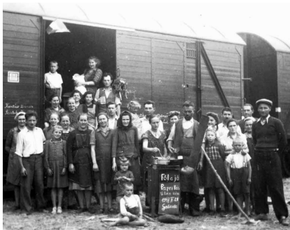
Csehszlovákia, Galánta – felvidéki magyarok kitelepítése