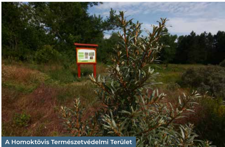
A Homoktövis Természetvédelmi Terület

A terv nagy hangsúlyt fektet egy eddig viszonylag elhanyagolt területre: a fővárosi vízgazdálkodásra. A klímavédelmet szolgáló vízmegtartó, csapadékvíz-hasznosító projekteken túl Újpesten a Szilas-patak meder-rehabilitációja lehet figyelemreméltó. A Rákospatakhoz hasonlóan ezt a vízfolyást is kiszabadítanák a csatornajellegű állapotból, környezetét rekreációs jellegűvé alakítanák. Ez azonban egyelőre nem része a projektnek, de távlati célkitűzés. TT