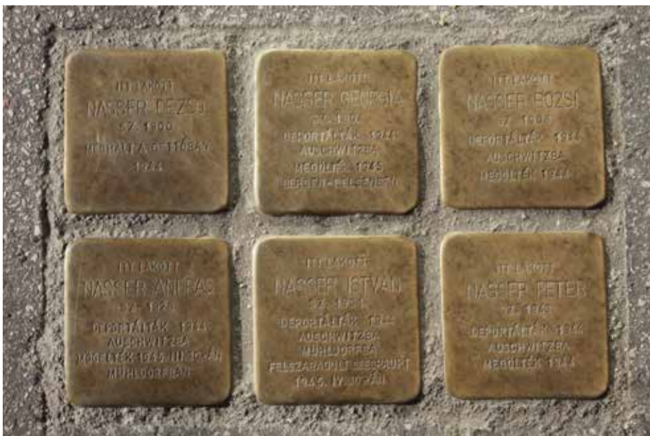
Újpesten több helyszínen botlatókövek őrzik az áldozatok emlékét