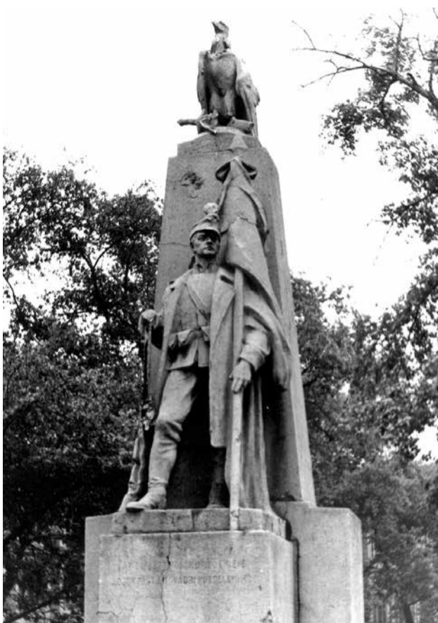
Az emlékmű 1971–72 környékén

Nagykárolyi gróf Károlyi István által alapított településünk születését 1840-re teszi a történetírás. Ekkor keletkezett az okirat, amelyben a gróf megfogalmazta, milyen feltételek és kedvezmények mellett adja hosszú távú bérletbe egységnyi telkenként megyeri birtokát. Ezek a bérlők tették le városunk alapjait. A települést azonban többféleképpen is nevezték.