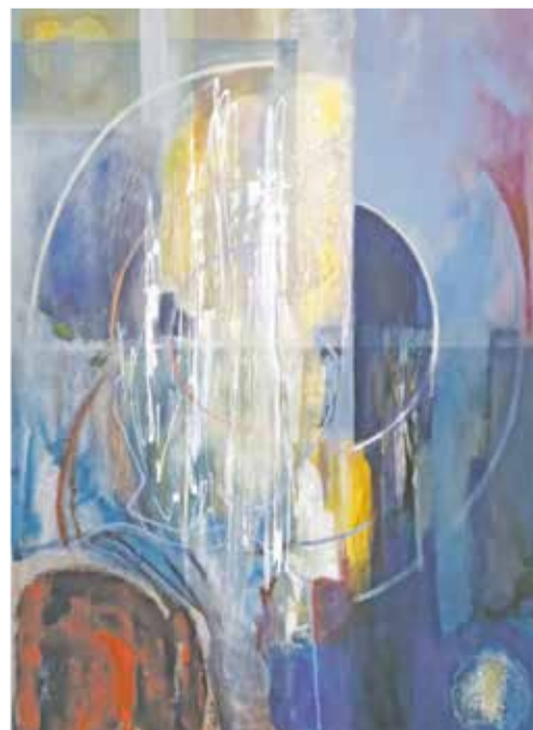
Szarka Hajnalka: Holdvilág I.