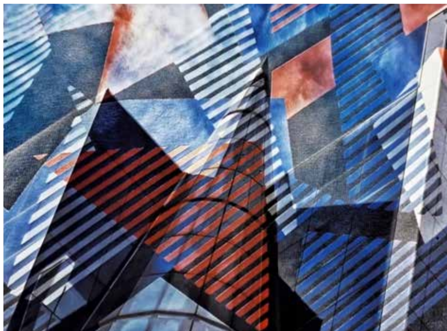
Vajda János: Absztrakt

pesti Művészek Társaságának tavaly év végén elmaradt kiállítását például, bár az csak az interneten látható, január 22-ére a valóságban is berendezte, a megnyitó után pedig az érdeklődők online tárlatvezetéssel ismerkedhettek az alkotásokkal – büszkélkedett el az Újpest Média-nak a központ igazgatója.