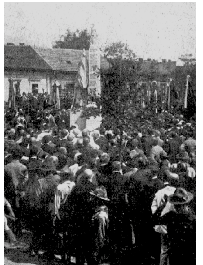
Az 1923-as avatóünnepség