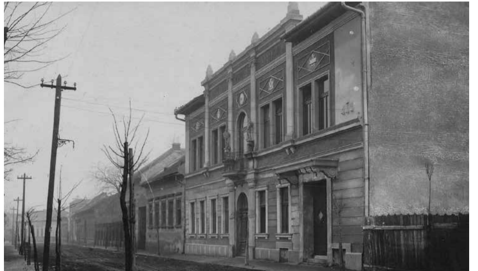
A Munkásotthon épülete 1928-ban

Az évek múltával szűknek bizonyult az egyszintes épület. 1926-ban az igazgatóság bővítési céllal külön részvényjegyeket bocsátott ki, ezek legnagyobb részét gyárakban adták el. Két évvel később elkészült az