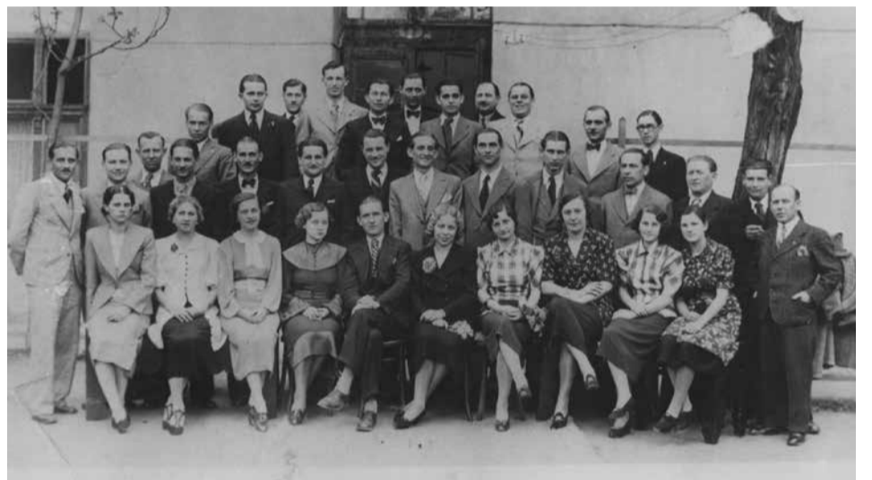
Műkedvelő gárda 1937-ben