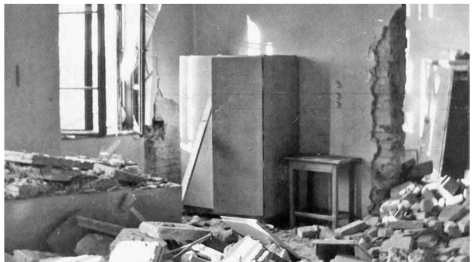
A Tanoda téri iskola belülről

Az '56-os Szövetség Újpesti Szervezetének elnöke úgy látja, november 4-nél csak Trianon traumája nagyobb. Szerinte 56-nak nem eszmeisége volt, hanem lelke, és a levert felkelés ellenére a magyar nép 1848 után újra megmutatta, hogy forradalmi lelkületű, és „nem lehet vele sokáig kibabrálni”. – A forradalom utóéletéhez ugyanakkor az is hozzátartozik, hogy a következő május elsején 100 ezrek vonultak fel a Hősök terén az új rezsim mellett, de tökéletesen érthető, hogy miért. Élni akartak az emberek – mondta a szövetség újpesti vezetője. BS