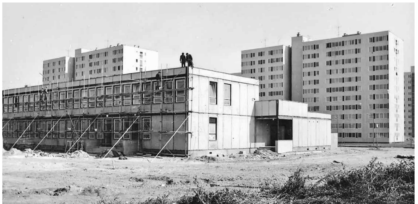
Épül a Pozsonyi utcai óvoda