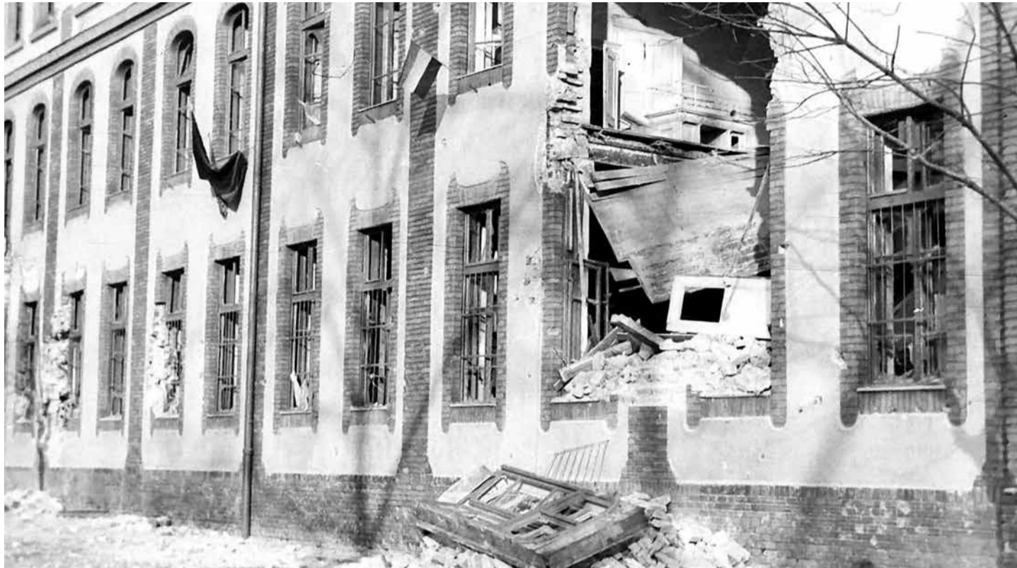
A Tanoda téri (akkoriban Április 4. téri) iskola belövései