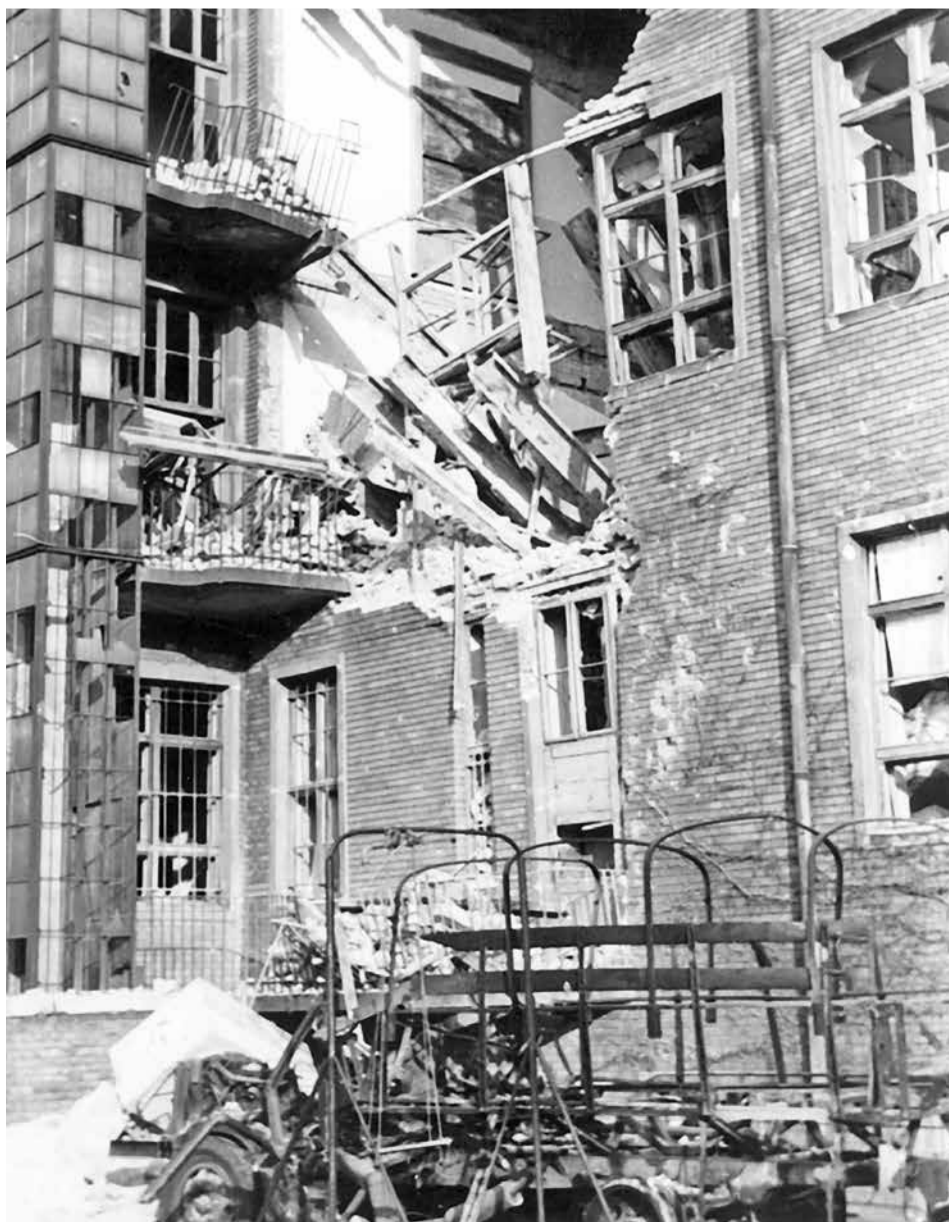
A Könyves Kálmán Gimnázium a szovjetek támadása után