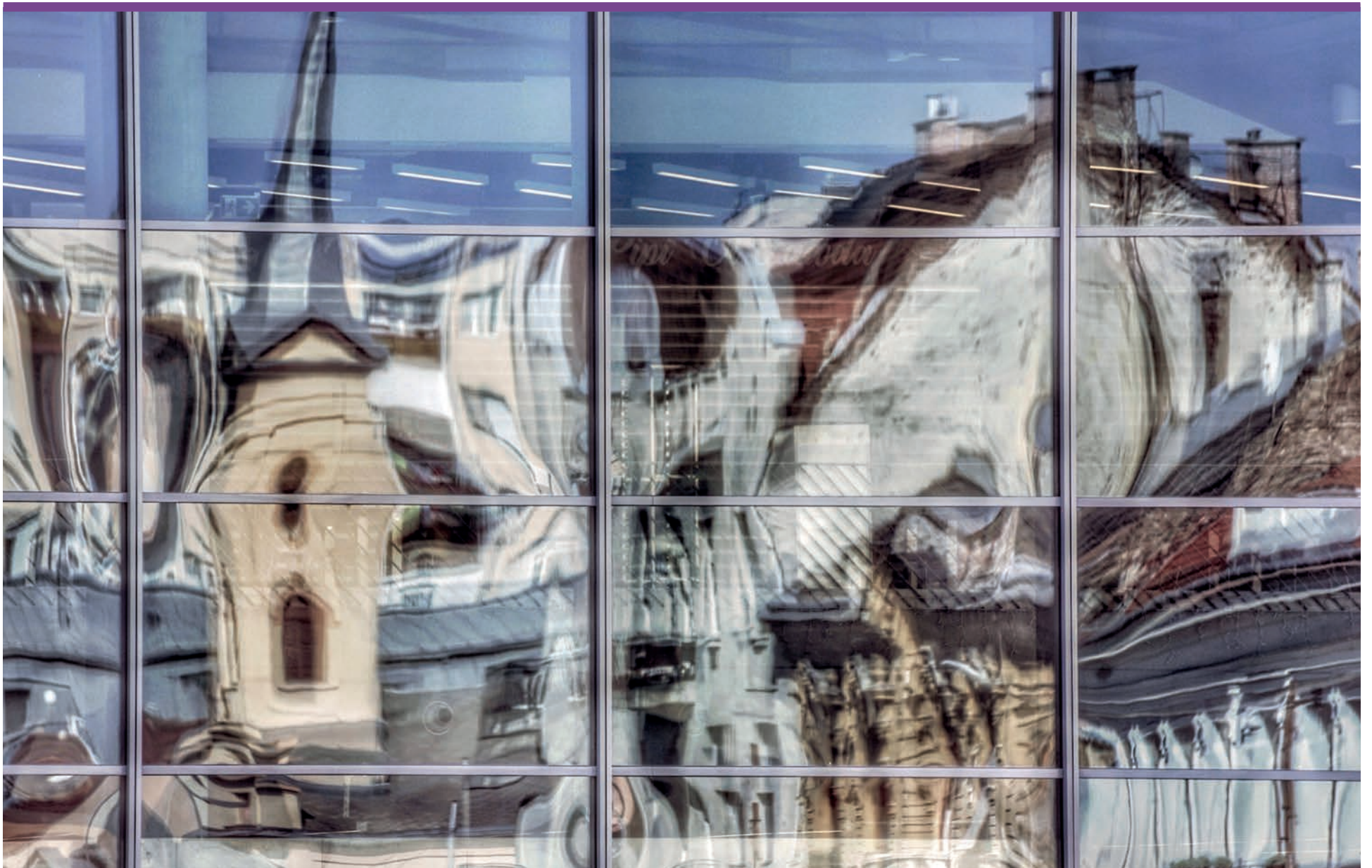
LACZKÓ-MAGYAR GYÖRGY: SZENT ISTVÁN TER MÄSKEP[PI]

ISTVÁNTELEK | KÁPOSZTÁSMEGYER | MEGYER | NÉPSZIGET | SZÉKESDŰLŐ | ÚJPEST