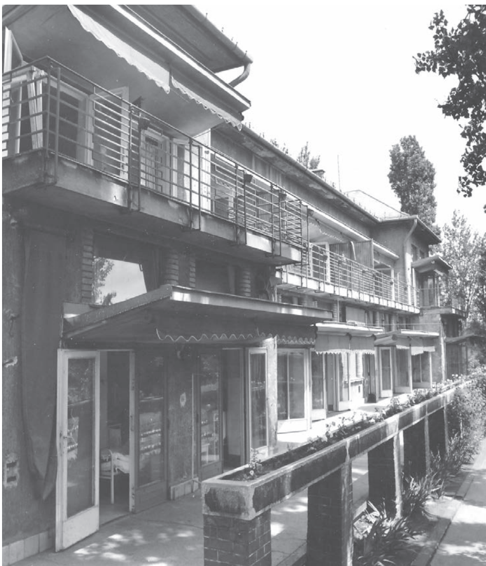
A sebészeti rehabilitációs osztály épülete a 70-es években

Nyár vége... az ősz kicsit mindig szomorkásabb, az idei pedig erősen kedélyromboló. Egyre rosszabb híreket hallunk a járványról, de igyekszünk elkerülni a komor hangulatot, bizakodunk, hogy rövidesen vége lesz, és sikerül legyőznünk ezt a kórt. Egy hasonló nehéz időszak hozta létre a korábban jelentős eredményeket elért Baross utcai kórházat is.