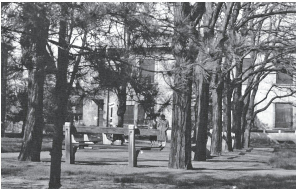
A járványkórház kertje a 60-as években