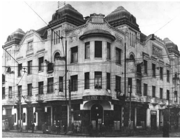
Árpád út 67. – a Diamant-ház

Vary (Karlsbad) vagy Mariánské Lázně (Marienbad) fürdőiben pihentek. Turisztikai céllal utazók számára az adriai partok közül Abbázia (Opatija) volt a legkedveltebb, de a tehetősebb polgárok eljutottak a francia Riviérára is. A hűsöltni vágyók magaslati üdülőhelyekre utaztak: Máriazell, Hartberg Mürrzusschlag (Ausztria)