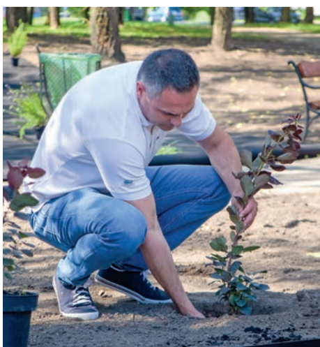
Trippon Norbert alpolgármester

Újabb állomásához érkezett a Vadvirágos Újpest program, melyet Trippon Norbert költségvetésért és projektmenedzsmentért felelős alpolgármester kezdeményezése alapján indított útjára Újpest Önkormányzata.