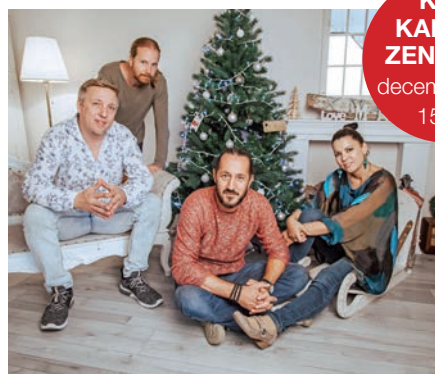
KISKALÁSZ ZENEKAR december 15. 15.00

Az ezüstvasárnap délutánja a gyerekeké. Két órától a Merende Műhely bábosai szórakoztatják őket, majd a többszörös aranylemezes Kiskalász zenekar tagjai adnak elő