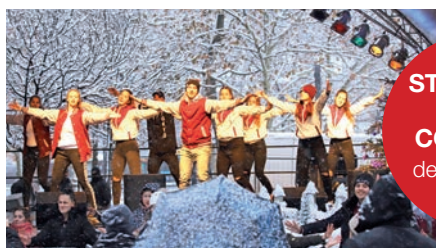
STARLIGHT DANCE COMPANY december 14. 15.30

A gyerekeket szombaton 18 órakor ezúttal is diavetítéses meseolvasás várja a templomkertben, vasárnap délután 3 és 6 között kézműves-foglalkoztató játékokban próbálhatják ki magukat, a Meseváros kapuja pedig egész hétvégén nyitva áll előttük.