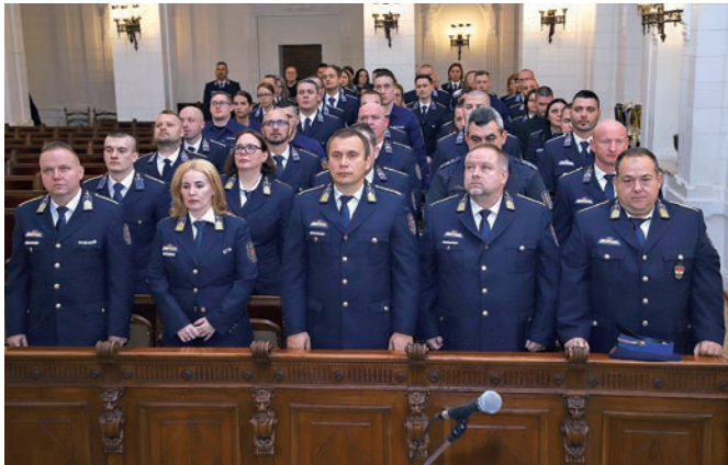
A kerületben, a kerületért dolgoznak

A kerületben, a kerületért dolgozó, kiemelkedő teljesítményt nyújtó rendőröket és tűzoltókat jutalmazta az önkormányzat.