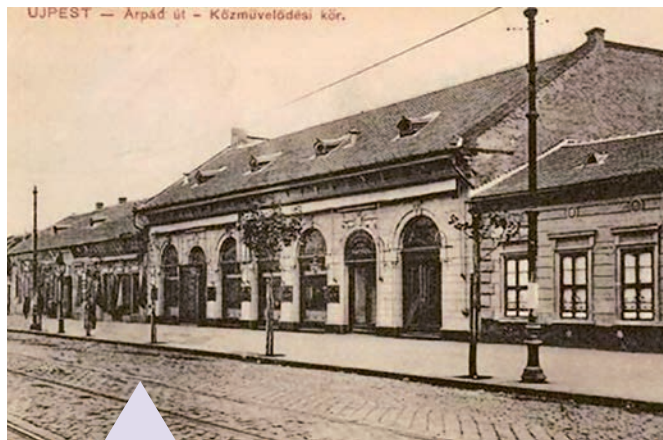
Képeslap 1910-ből. Az Újpesti Közművelődési Kör épületének egyetlen ismert ábrázolása.

összegyűjtött pénzből foglalták le. A házépítési alap adományokból, lakossági és banki