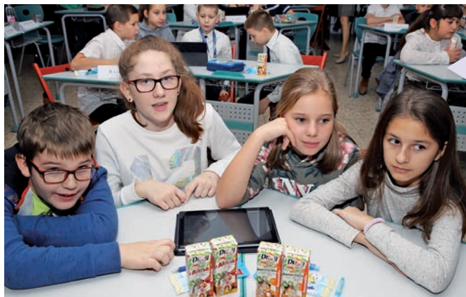
Csillogtak a szemek, csikorogtak a fogaskerekek

A Károlyi István Általános Iskolában és Gimnáziumban rendezte meg az újpesti általános iskolák hagyományos helytörténeti vetélkedőjét az Újpesti Helytörténeti Alapítvány.