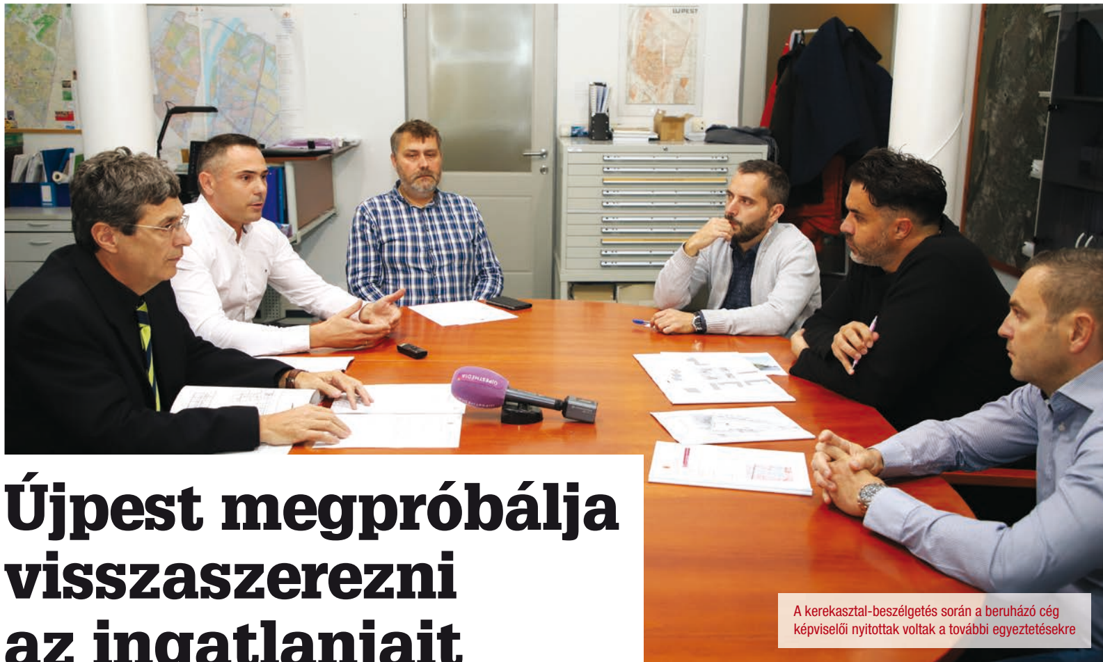
A kerekasztal-beszélgetés során a beruházó cég képviselői nyitottak voltak a további egyeztetésekre