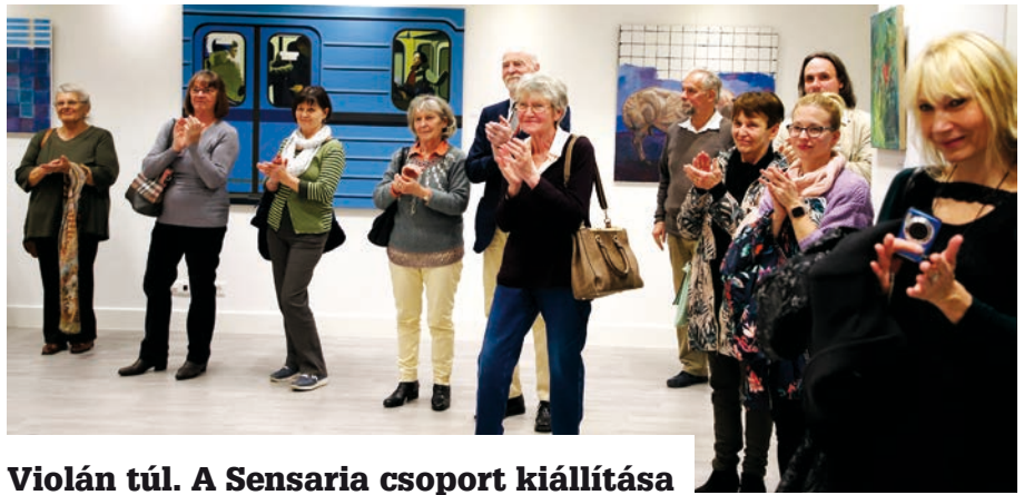
Violán túl. A Sensaria csoport kiállítása

Helyszín: Újpest Kulturális Központ – Ifjúsági Ház (1042 István út 17–19.) Jelentkezni 2019. november 22-ig név, cím, telefonszám megadásával az ifjusagicaritas@gmail.com e-mail címen, vagy 8 és 17 óra között az alábbi telefonszámokon lehet: 06-1/231-7070, 06-30/650-8205. A programot Újpest Önkormányzata, valamint a Nemzeti Együttműködési Alap támogatja.