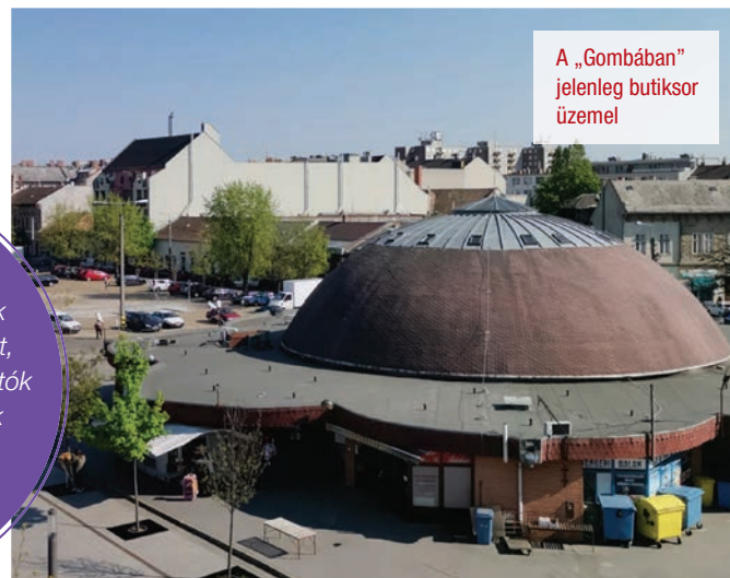
A „Gombában” jelenleg butiksor üzemel

A tervezett fejlesztések évtizedekre meghatározzák városunk központi terének arculatát, fejlődését, és az ide látogatók minőségi kiszolgálásának lehetőségeit. Az Újpesti Párbeszéd eredménye is azt bizonyította, hogy az újpestiek egy fejlesztéspárti, hosszútávon gondolkodó, s a jövő érdekében felelősen vállalkozó Önkormányzatot szeretnének, a magas szintű szolgáltatások biztosítása érdekében. A térrehabilitáció komplex megvalósításával az önkormányzat nemcsak a korábban gazdaságtalanul működtetett több intézményét tudta kiváló környezetbe áthelyezni, de egy élhetőbb, funkcionális is tervezett nagyvárosi környezetet, egy élő városközpontot tud létrehozni Újpest központjában.