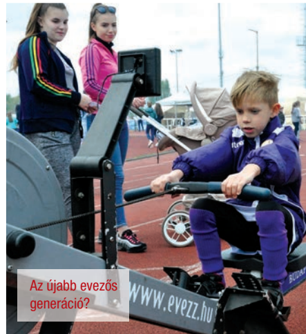
Az újabb evezős generáció?