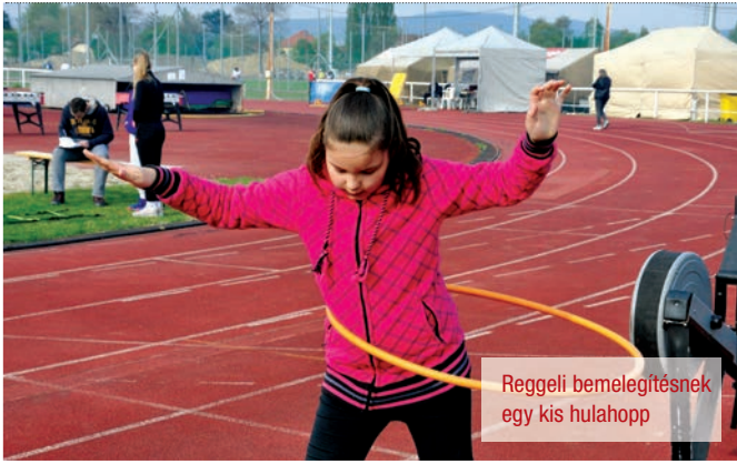
Reggeli bemelegítésnek egy kis hulahopp