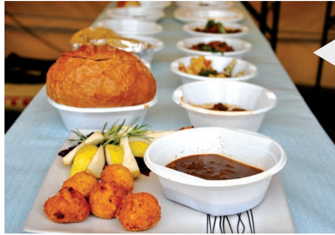
Idén közel száz csapat indult a főzőversenyen