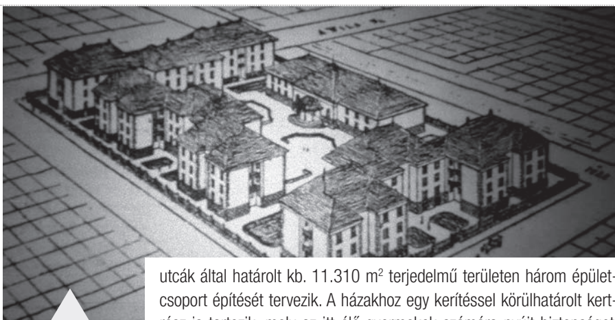
A városi házak látványterve a Mátyás tér felől nézve

A bevezető után részletes ismertetést olvashatunk a Mátyás téri házak terveiről. A város a Speyer kölcsönből erre a célra megközelítőleg 700.000 aranykoronát irányzott elő, melyből a tervek szerint 162 kislakás építése valósulhat meg. Hírt ad arról is, hogy az önkormányzat kijelölte a megfelelő területet is: az Attila, Türr István, Nádor és Pöltenberg