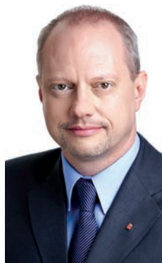
Dr. Molnár Szabolcs alpolgármester

A kiírás, a részletes pályázati feltételek és az űrlapok beszerezhetők az Újpesti Önkormányzat Ügyfélszolgálati Irodáján vagy letölthetők az ujpest.hu oldalról, a Pályázatok menüpont alatt, a „Pályázati felhívás Újpesti Diákösztöndíjak elnyerésére a 2018/2019. tanévre” linkre kattintva. A kérelmeket 2018. szeptember 30-ig fogadja be a Polgármesteri Hivatal Ifjúsági, Sport, Művelődési és Oktatási Osztálya.