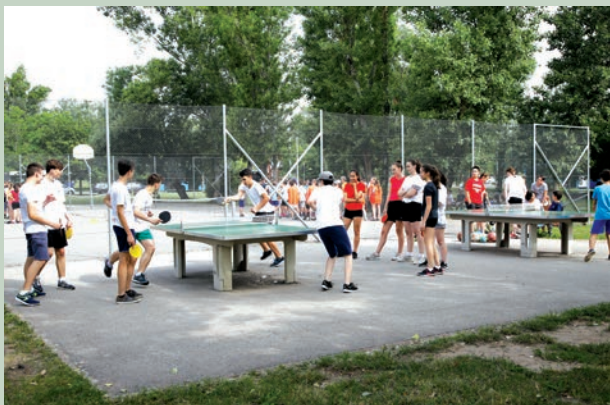
A Szilas Családi Park rendkívül népszerű a Káposztásmegyeren és az Izzó lakótelepen élők körében