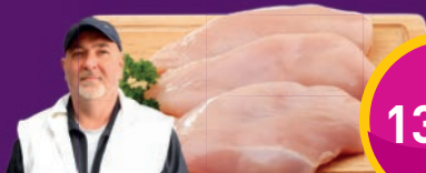
CSIRKEMELLFILÉ Te-So Bt.-nél