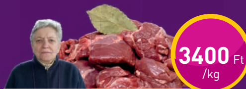
ŐZHÚS Vadász Kamrája Kft.-nél