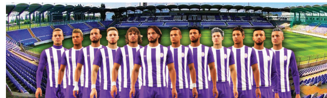
Magyar Kupa R32 UTE e-Sport - FC Rivincita 1:0 Gólszerző: Valent1n94

A találkozó harmadik percében Hideghetes szép kiugratása után Valent1n94 gólrá váltotta a ziccert (1-0). A gyorsan szerzett vezetőlátalát megnyugtatta a csapatot, végig irányították a mérkőzést. Szép számmal akadtak még lehetőségek az előny növelésére, azonban hol a kapufa, hol az ellenfél kapusa hátrított. Szerencsére az egygólos előny kitarított a találkozó végéig. Örömmel, hogy egy küzdelmes meccsen, végül is győzelemmel mutatkoztak be a legfiatalabb újpesti szakosztály versenyzői a szurkolóknak.