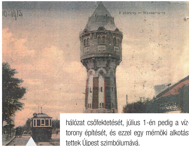
Újpesti képeslaprészlet a víztoronyról (1913)

Főleg, hogy ott magasodik egy villamosvonal, a volt 10-es végállomásaként Rákospalota és Újpest határán. Uralja a helyzetet tulajdonképpen a kikötőig. De arra talán nem gondolt senki, hogy egyáltalán mi ez, hogy került oda, és mi célból. Igen, ez a víztorony, de ezen kívül semmi több. Pedig érdekelhetne bennünket, hogy 107 éve, 1911 április 1-én kezdték meg a vízvezeték-