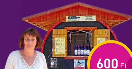
OLASZRIZLING Lics Pincészetnél