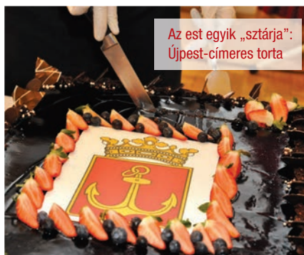
Az est egyik „sztárja”: Újpest-címeres torta