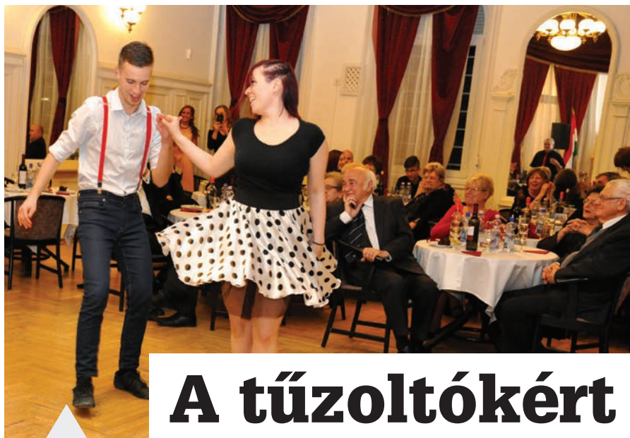
Tánc nélkül nincs bál