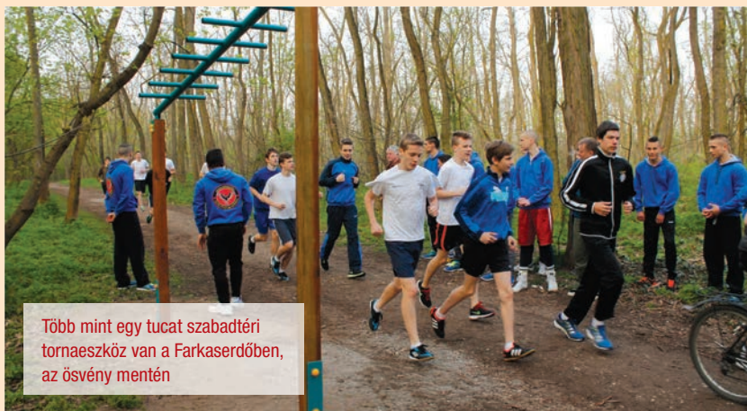
Több mint egy tucat szabadtéri tornaeszköz van a Farkaserdőben, az ösvény mentén

Ami mondjuk 20 évvel ezelőtt természetes volt, azt ma már szinte csak előre kidolgozott tervek, praktikumok, jól felépített, fegyelmezett életvezetés mellett lehet elérni. Friss levegő, elegendő mozgás, megfelelő táplálkozás, aktív közösség élet, sok természet, minél kevesebb szobában gubbasztás.