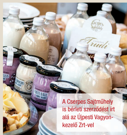
A Cserpes Sajtműhely is bérleti szerződést írt alá az Újpesti Vagyonkezelő Zrt-vel