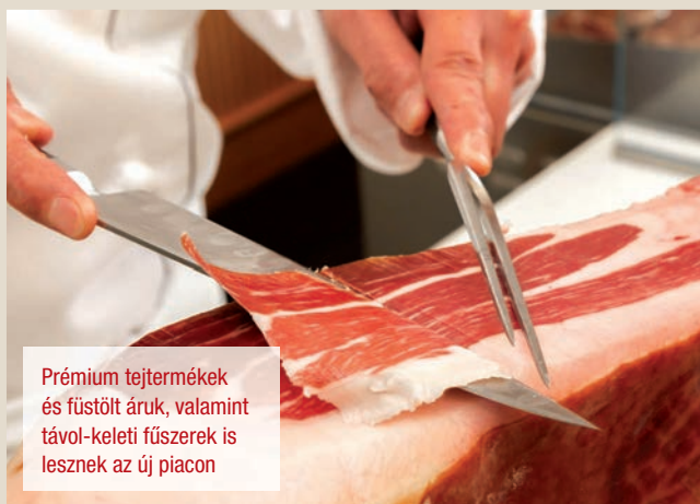
Prémium tejtermékek és füstölt áruk, valamint távol-keleti fűszerek is lesznek az új piacon