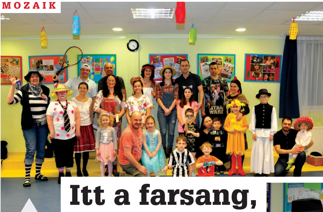
A jelmezek ezúttal is zseniálisak, a hangulat pedig fergeteges volt