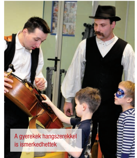
A gyerekek hangszerekkel is ismerkedhettek

Az Újpesti Kulturális Központ Megyeri Klub és a Káposztási Családok Egyesülete ötödik alkalommal szervezett közösen családi farsangot a Bem Néptánc-együttes tagjainak közreműködésével.