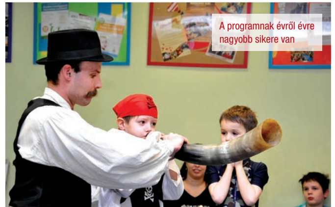
A programnak évről évre nagyobb sikere van