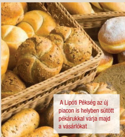
A Lipóti Pékség az új piacon is helyben sültöt pékárukkal várja majd a vásárlókat

A régi piac ismert és kedvelt árusaival is találkozhatunk majd az új piacon. Lesz savanyúságos, magárus, édességbolt, pékáruüzlet, zöldséges, hentes, sőt lesz kínai vegyesbolt is.