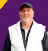
KACSCACOMB Te-So Bt.-nél