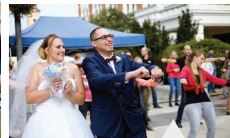
Egy ifjú pár is beszállt a közös táncba