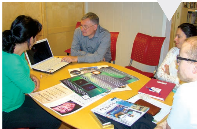
Úrközponti szakmai megbeszélés

Az andenesi Videregående Skole-ban kölcsönösen bemutatott iskoláinkat. Andenesben a 15-16 éves diákoknak lehetőségük van egy