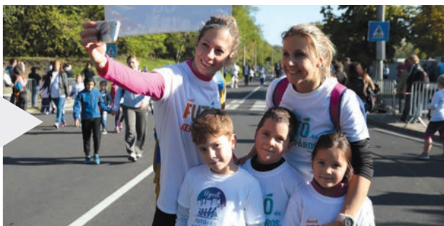
Jól megéredemelt közös szelfi a célban