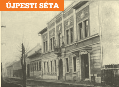
A Munkásotthon egykori épülete