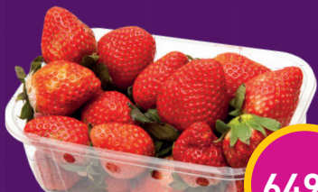
EPER Tóth Zoltánnál

Az esetleges szerkesztési vagy nyomdai hibákért felelősséget nem vállalunk. A képek csak illusztrációkat szolgálnak.