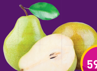
VILMOSKÖRTE Policsány Erikánál