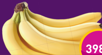
BANÁN Rozvadszky Tibornál