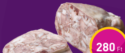
DISZNÓSAJT O.K. Hús Kft.-nél