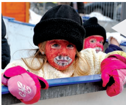
A hideg sem volt akadály. Sapka, sál és kezdődhetett is a verseny

Még január 29-ig, azaz vasárnapig korizhatunk a Szent István téri jégpályánkon. Ha a tél és a hideg nem is, a csúszkálás biztosan mindenkinek hiányozni fog. A legelszántabbak minden percet kihasználtak, volt jelmezverseny, jégközi, szánkózás. Mondjuk a legsportosabb városban ez nem is meglepő, igaz?