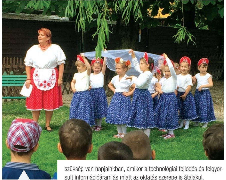
Pünkösdi királylányválasztás a Vadgesztenye Óvodában