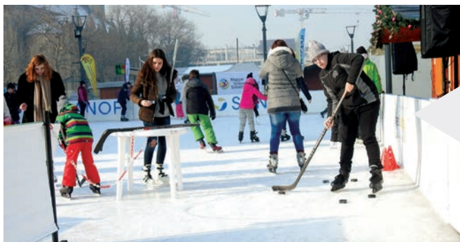
A hokit és a jégszánt is mindenki nagyon élvezte