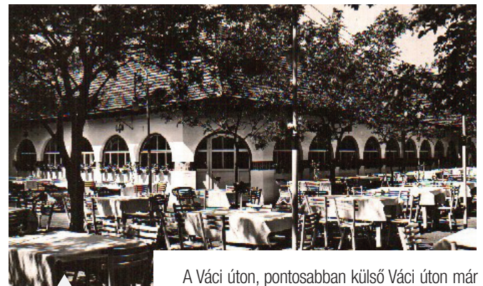
A Megyeri Csárda terasza régen, ahol gyakran hírességek is megfordultak