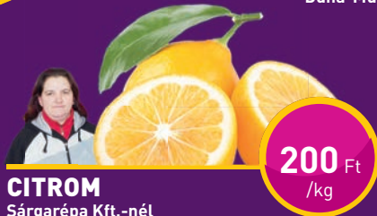
CITROM Sárgarépa Kft.-nél