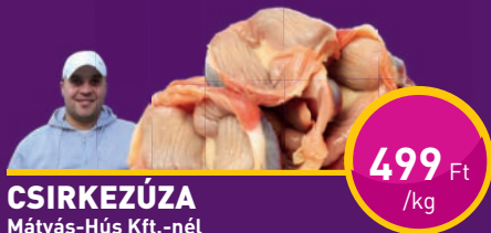
CSIRKEZÚZA Mátyás-Hús Kft.-nél