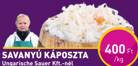
SAVANYÚ KÁPOSZTA Ungarische Sauer Kft.-nél