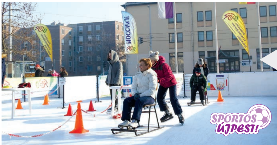
A Moccanj! téli sportfesztiválhoz természetesen Újpest is csatlakozott. Január 21-én reggel kilenctől egészen hajnali kettőig volt nyitva a jégpálya. Dél előtt próbákat is lehetett teljesíteni, amit láthatóan mindenki nagyon élvezett