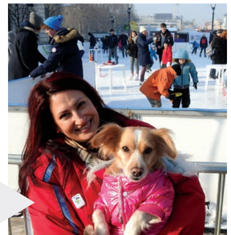
Nálunk még a koripálya is kutyabarát