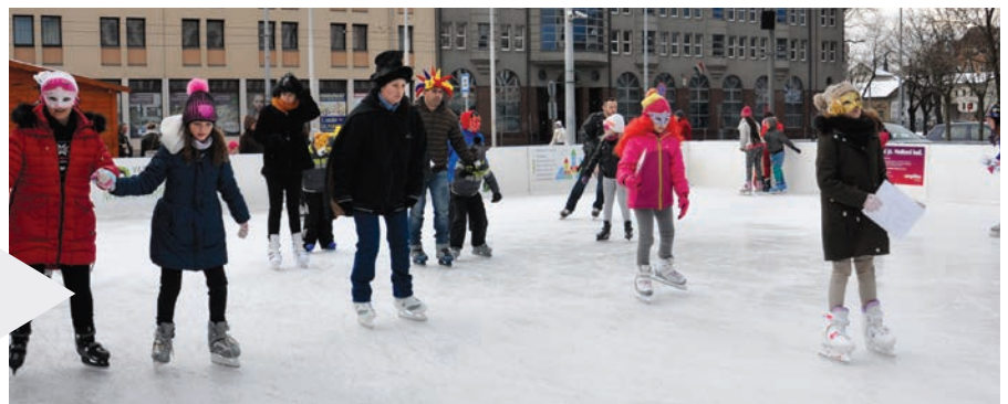
A felnőttek és a gyerekek is szívesen bújtak jelmezbe