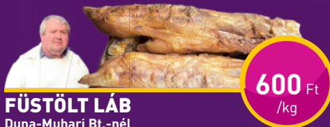
FÜSTÖLT LÁB Duna-Muhari Bt.-nél