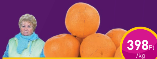
MANDARIN Dream Come True Kft.-nél