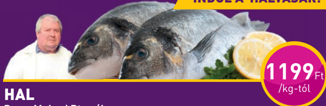
HAL Duna-Muhari Bt.-nél