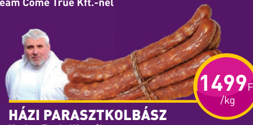
HÁZI PARASZTKOLBÁSZ Kosher Trade Kft.-nél