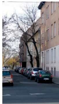
Az egykori Rezi Károly (ma Király) utca

Így tettünk, de a Rezi Károly utcában földbe gyökerezett a lábunk, ahogy ezt mondani