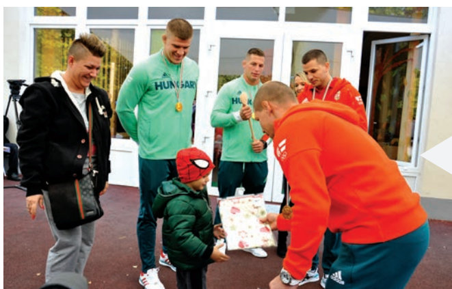
A díjakat olimpiakonok adták át a gyerekeknek