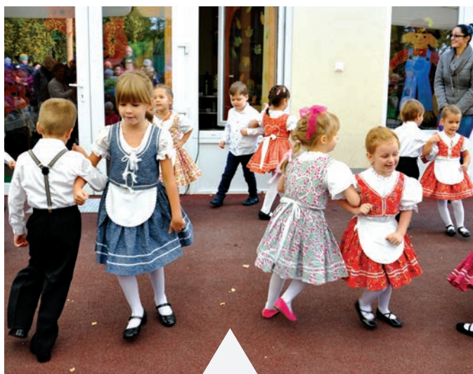
A megnyitőünnepségre a Szlovák Tanítási Nyelvű Óvodából is érkeztek gyerekek

Közös mozgás, sok nevetés és aranyérem mindenkinek. A szombati munkanap sporttal telt a Lakkozó Tagóvodában. A már hagyományosnak számító családi nap tematikája idén az olimpia volt.