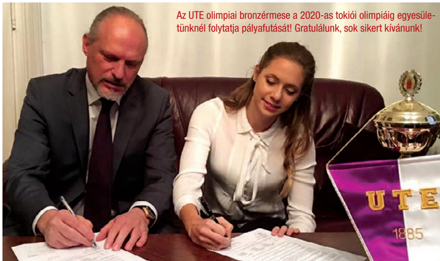
Az UTE olimpiai bronzérmese a 2020-as tokiói olimpiáig egyesületünknel folytatja pályafutását! Gratulálunk, sok sikert kívánunk!