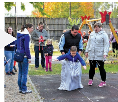
Az egész család együtt mozgott