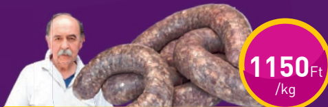
HÁZTÁJI MÁJAS, VÉRES HURKA Kedves Hentes Kft.-nél