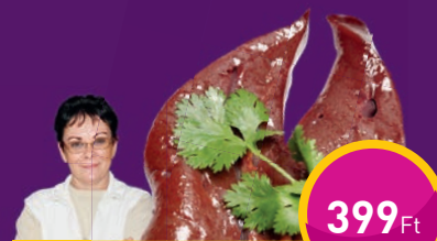
SERTÉSMÁJ Duna-Muhari Bt.-nél