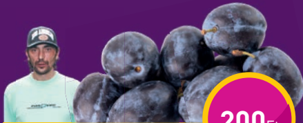
BESZTERCEI SZILVA Dream Come True Kft.