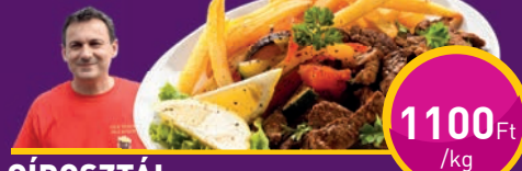
GIROSZTÁL Grill Gírosnál