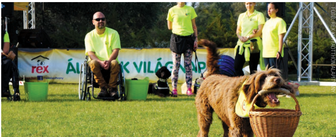
FOTÓ: REX KUTYAOTTHON ALAPÍTVÁNY

macskához vagy a nyúlhoz. A képeken szintén látható, hogy a nagyobb kutya már ölben utazik a mozgólépcsőn, a póráz és a szájkosár pedig elengedhetetlen kellék – metróon, buszon villamoson egyaránt. Kép és szöveg: MOA