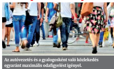
Az autózás és a gyalogosként való közlekedés egyaránt maximális odafigyelést igényel.

Felgyorsult világunkban a megnövekedett járműforgalom következtében az autózás és a gyalogosként való közlekedés egyaránt maximális odafigyelést igényel . Hogy megelőzzük a baleseteket az utakon, pontosan kell hallanunk, milyen irányból jönnek az autók, a buszok, a kerékpárosok vagy éppen a gyalogosok. Ahhoz, hogy a hang irányát meg tudjunk állapítani, működnie kell az úgynevezett térbeli hallásunknak . Ennek alapvető feltétele pedig az, hogy mindkét fülünkkel tökéletesen jól halljunk. Ebből következik, hogy számos kisebb-nagyobb balesetet el lehetne