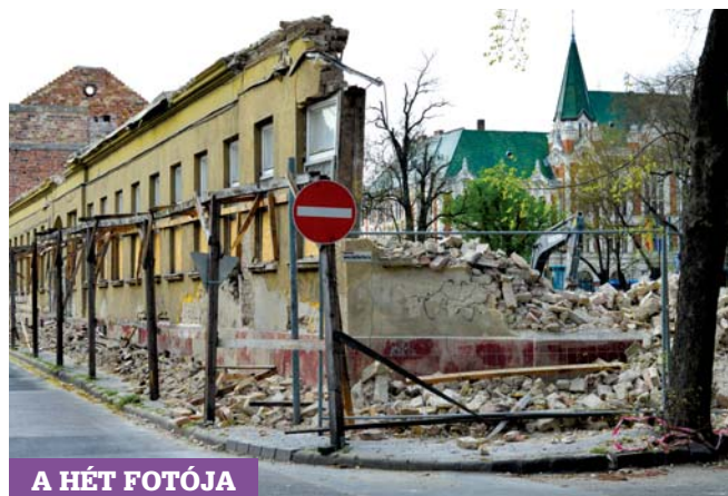
A HÉT FOTÓJA