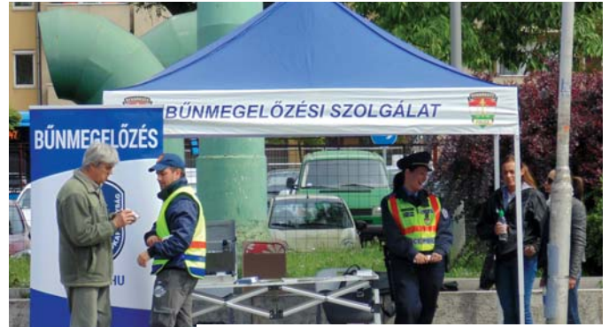
Ismét forgalmas helyszín és teljes körű tájékoztatás

A másik módszer unokázás néven vált ismertté, lapunkban és az ujpest.hu -n is sokszor felhívtuk rá a figyelmet, aminek köszönhetően könnyebben ismerik fel a csalásformát az idősek. Továbbra sem szabad bedőlniük olyanoknak, akik az éjszakai órákban unokaként bemutatkozva telefonálnak azzal, hogy balesetet szenvedtek/okoztak, bajba jutottak és pénzre van szükségük. Azt sem szabad elhinni, hogy a hozzátartozó okozott balesetet, minden esetben olyan adatokat kell kérdezni a telefonálótól, amit csak a valódi rokon tudhat. A pénz útgyintén nem szabad ismeretlennek átadni.