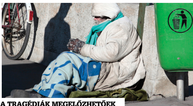
A TRAGÉDIÁK MEGELŐZHETŐEK

Néhányan jelezték az önkormányzat felé, hogy nagyobb méretű töcsákat észleltek a parkokban. Ez a legtöbb helyen természetes jelenség, a fagyos földre ugyanis nehezebben, lassabban tud beszivárogni a víz. Az önkormányzat ezért az újpestiek türelmét kéri. Amennyiben valaki túlzottan nagyknak ítéli meg egy töcsa méretét és napokkal később sem tapasztal változást, kérjük, küldjön fotót a pontos cím megjelölésével a varosuzemeltetes.oszt@ujpest.hu email címre.