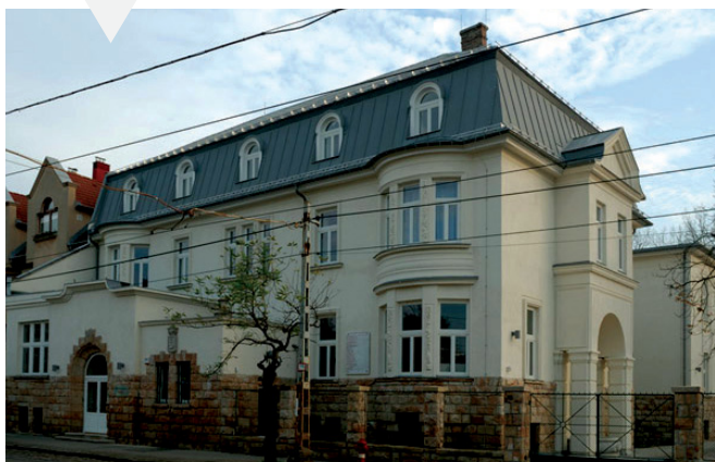
A felújított szülőotthon épülete

Na, ez az a pillanat volt, és már indultunk is! Pedig bejutásunk előző este nem volt zavartalan!