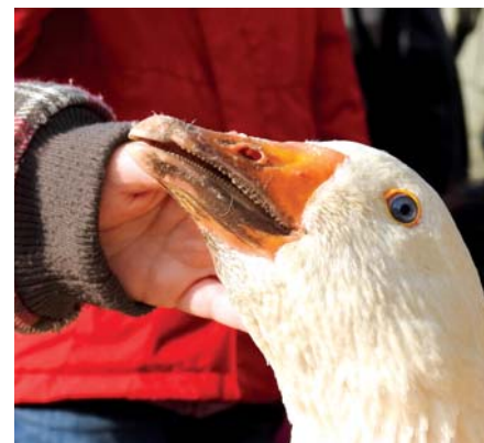
A Márton-napi libaságok előtt és után is nagy volt a nyüzsgés a Piac-Placcon.