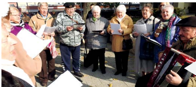
A Piacfelügyelőség megvendégelte a látogatókat