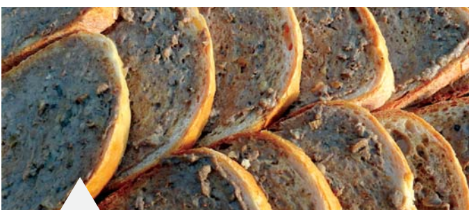
Libamájzsíros-kenyér bőven jutott mindenkinek a Márton-napi rendezvényen