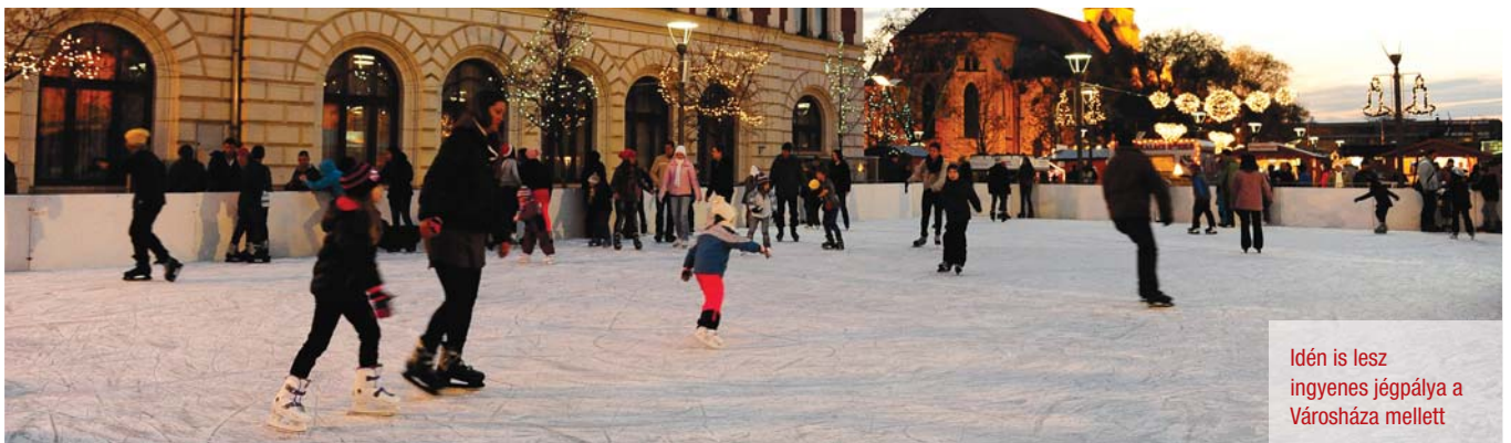
Idén is lesz ingyenes jégpálya a Városháza mellett