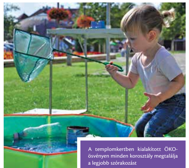
A templomkertben kialakított ÖKO-ösvényen minden korosztály megtalálja a legjobb szórakozást