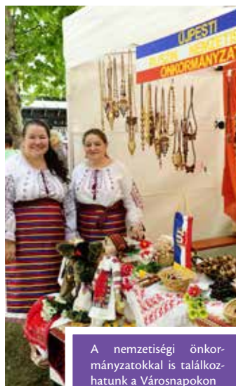
A nemzetiségi önkormányzatokkal is találkozhatunk a Városnapokon