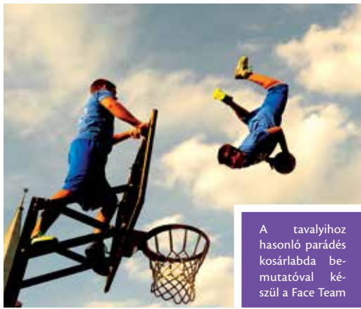
A tavalyihoz hasonló parádés kosárlabda bemutatóval készül a Face Team