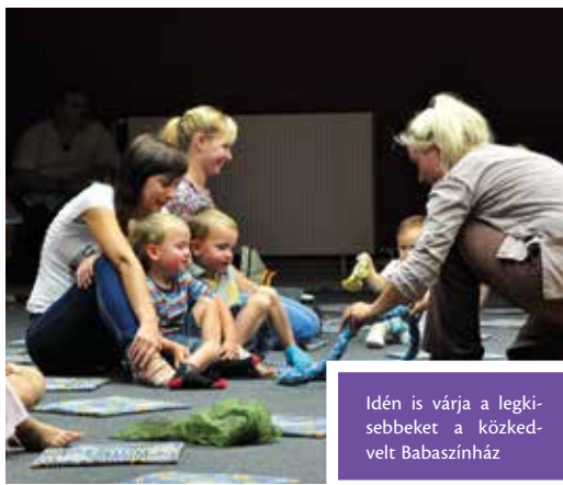
Idén is várja a legkisebbeket a közkedvelt Babaszínház