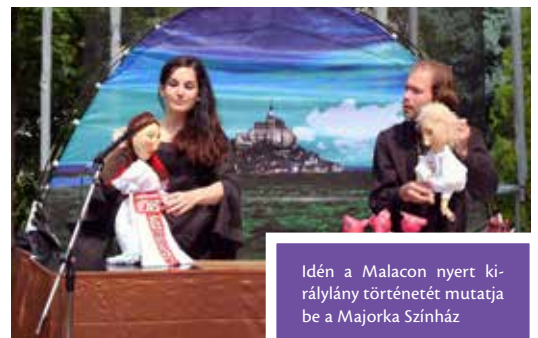
Idén a Malacon nyert királynő történetét mutatja be a Majorka Színház