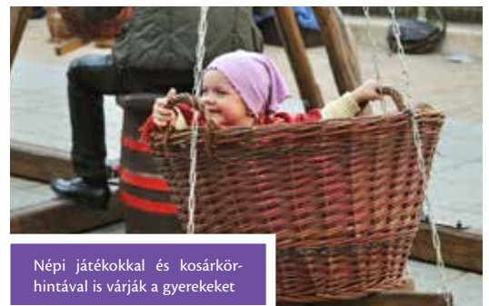
Népi játékokkal és kosárkörhintával is várják a gyerekeket