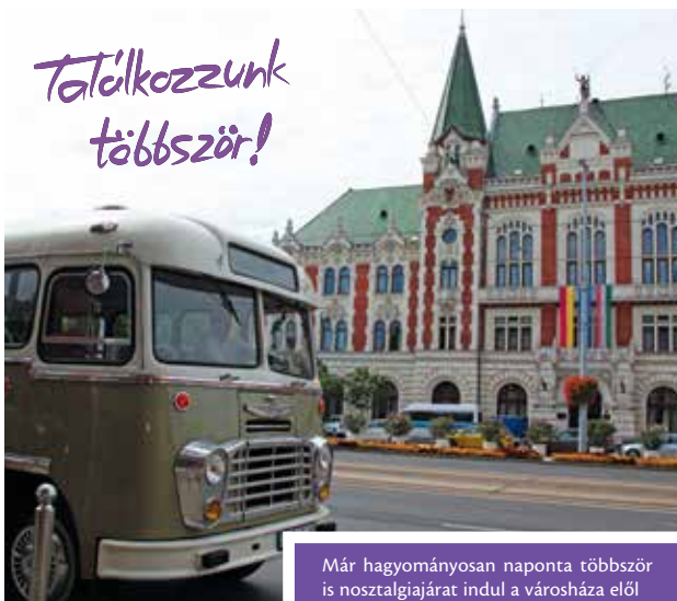
Már hagyományosan naponta többször is nosztalgiajárat indul a városháza elől