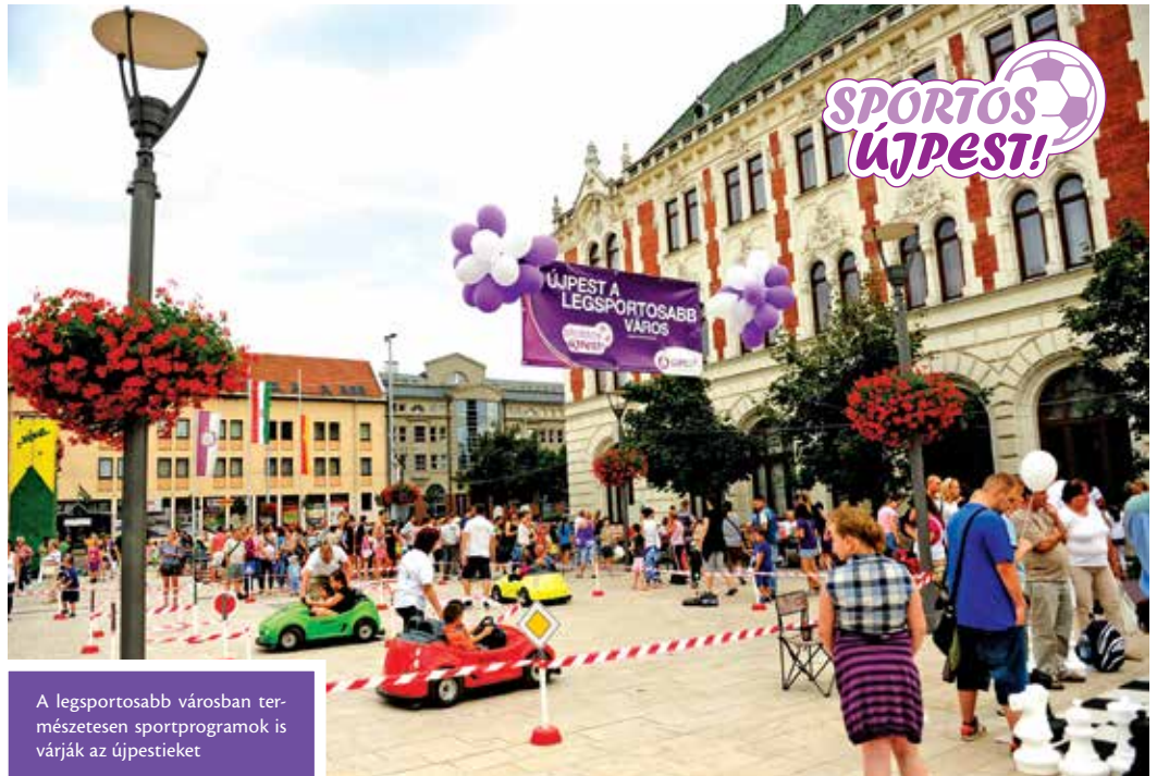
A legsportosabb városban természetesen sportprogramok is várják az újpestieket