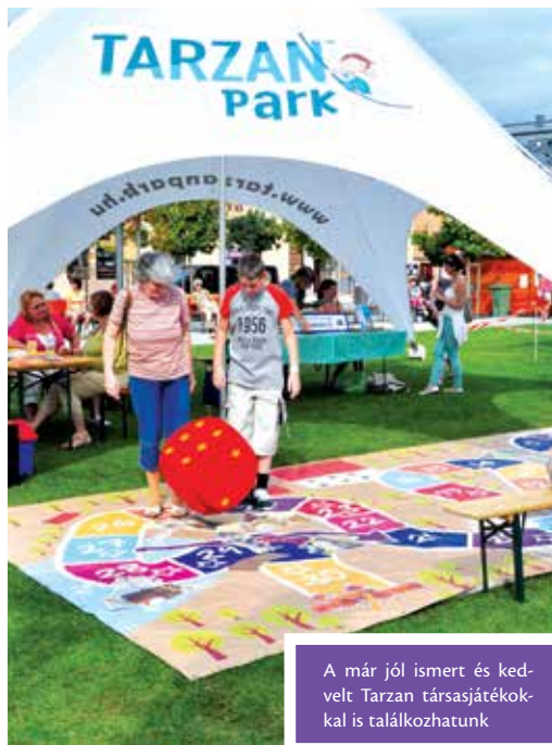
A már jól ismert és kedvelt Tarzan társasjátékkal is találkozhatunk