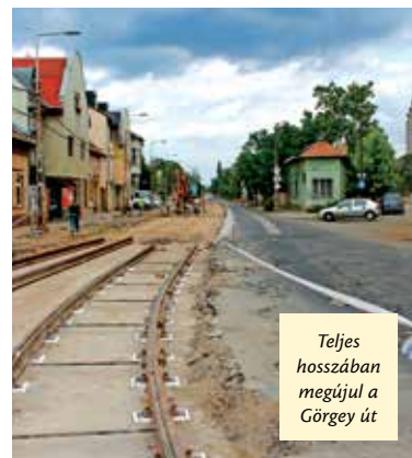
Teljes hosszában megújul a Görgey út

Februárban a Görgey út régóta várt rekonstrukciója is elkezdődött. Ez az utóbbi évek egyik legnagyobb beruházása Újpesten, és ugyan a vége még messze van, már most is látványos a változás. Augusztus első hetére a felújítás második üteme is befejeződik és jöhet a harmadik, egyben utolsó szakasz. 2016. február végére nem csak az úttest újul meg, hanem a 12-es és a 14-es villamos pályája és megállói is, valamint kétirányú kerékpársáv épül.