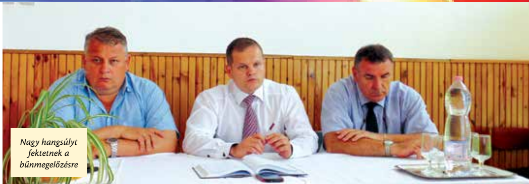
Nagy hangsúlyt fektetnek a bűnmegelőzésre

Február végétől egyre szorosabb az együttműködés a Káposztási Családok Egyesületével. A KCSE csaknem ezer címet számláló levelezőlistáján folya-