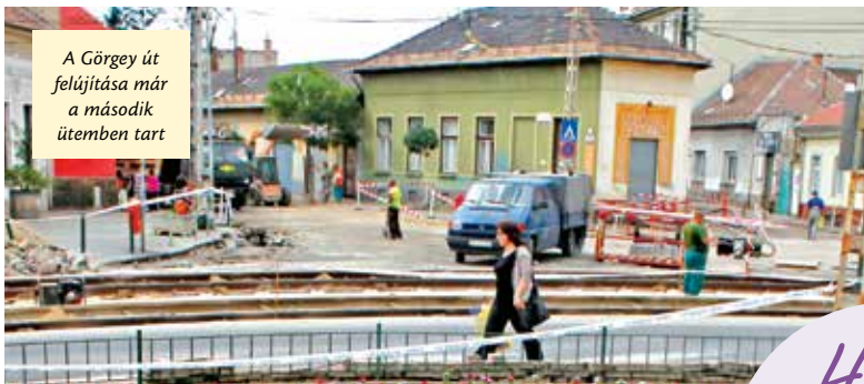
A Görgey út felújítása már a második ütemben tart