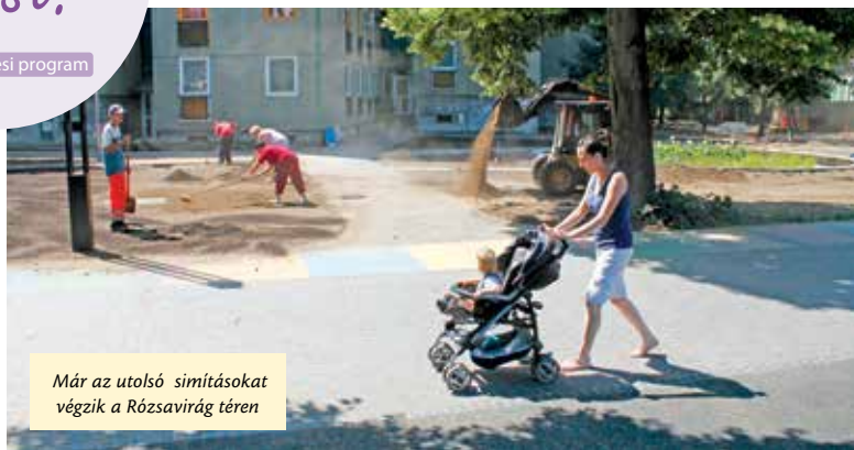
Már az utolsó simításokat végzik a Rózsavirág téren

Pakolás, indulás, aztán ki gondol az otthonra, igaz? De mire hazatérünk a nyaralásból, szinte rá sem fogunk ismerni Újpest egyes részeire. A Tél utca felújítása már megtörtént és szorosan követi a hozzá közel eső Rózsavirág tér is. Augusztusra teljesen új külsőben pompázik majd városunk egyik legnagyobb és már most legnépszerűbb közösségi tere. Új járda, pingpong asztalok, kutyafuttató, ivókút, minden a pihenés és a nyár szolgálatában áll.