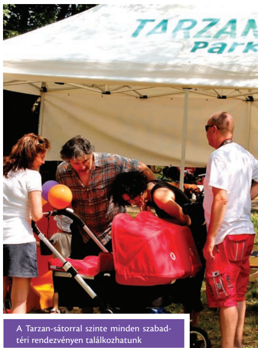
A Tarzan-sátorral szinte minden szabadtéri rendezvényen találkozhatunk