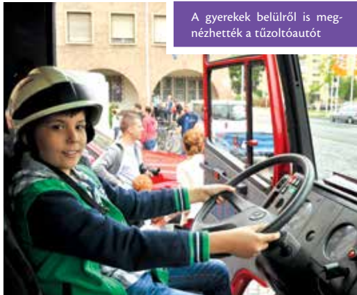
A gyerekek belülről is megnézhették a tűzoltóautót

Május utolsó vasárnapján a gyerekeké volt a főszerep. Gyermeknap alkalmából különleges programmal várta őket a Tarzan Park, a Vadgesztenye utca és a tűzoltóság is.