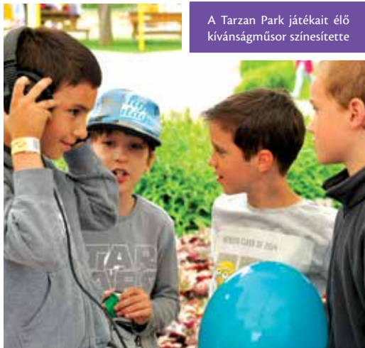
A Tarzan Park játékeit élő kívánságműsor színesítette