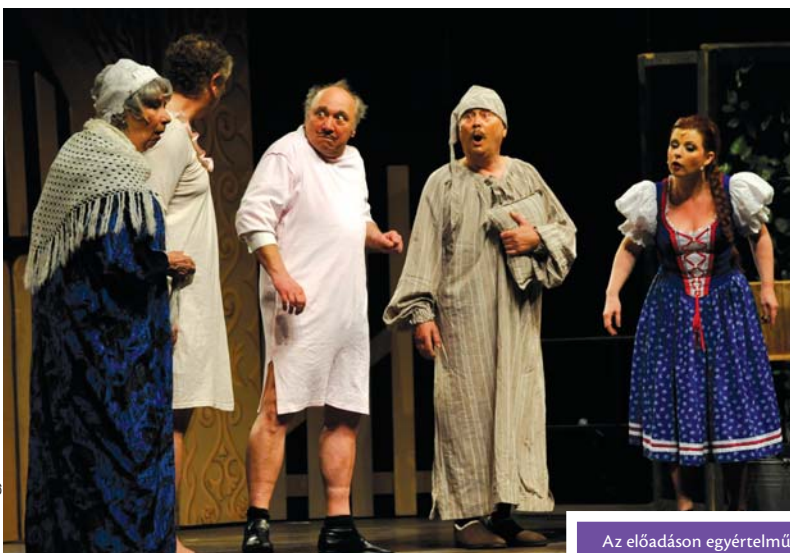
Az előadás egyértelműen a nevetése volt a főszerep