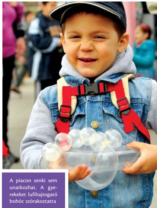
A piacon senki sem unatkozhat. A gyerekeket lufihajtogató bohóc szórakoztatta