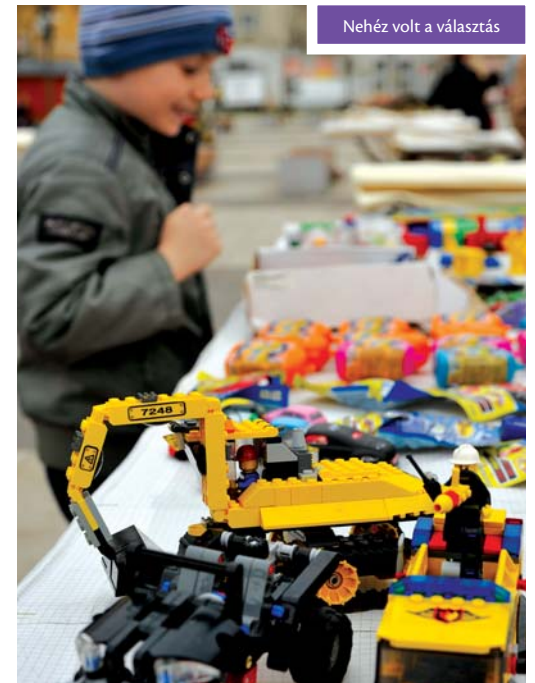
Nehéz volt a választás