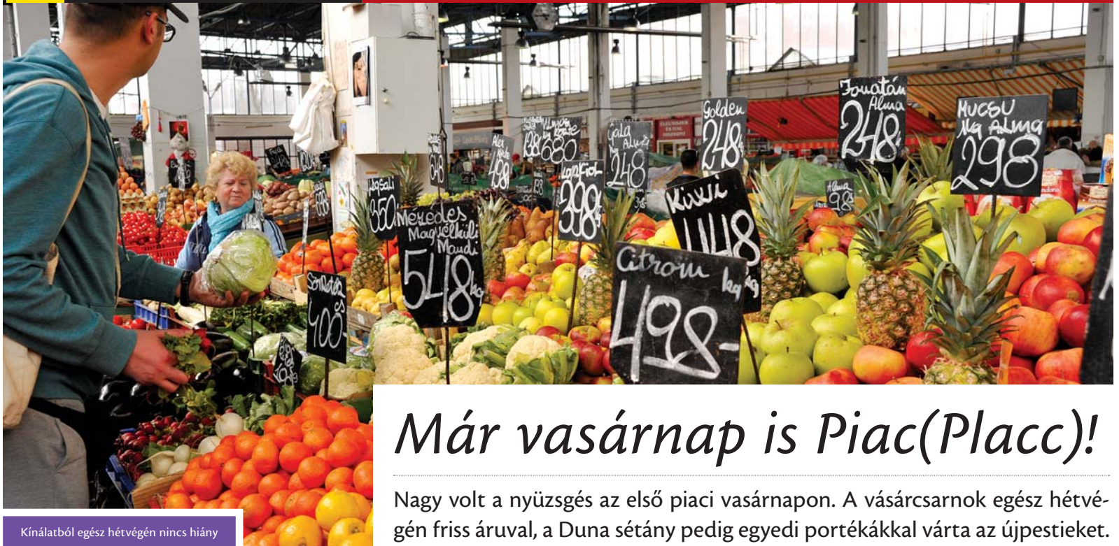
Kínálatból egész hétvégén nincs hiány