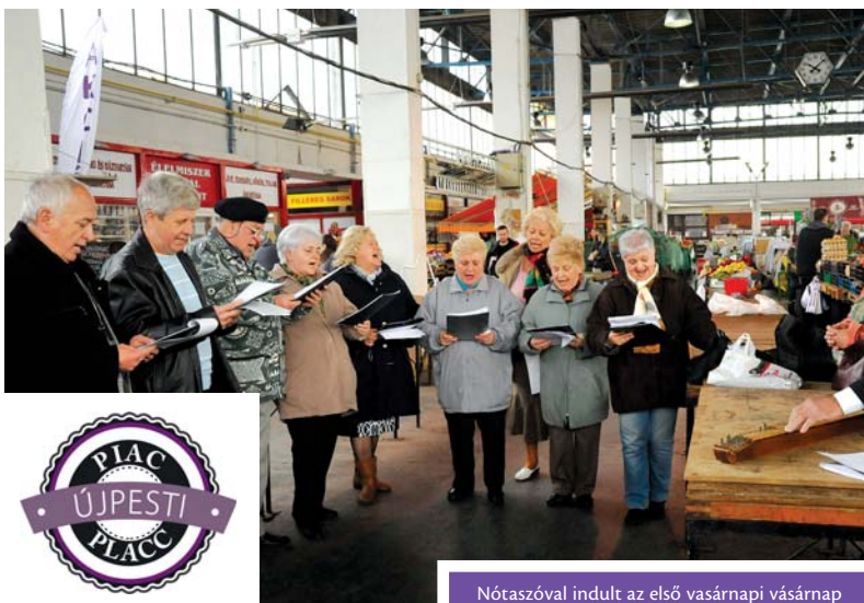
Nótaszóval indult az első vasárnapi vásárnap