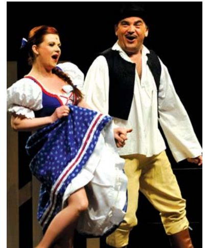
A vidám előadás mindenki jól szórakozott