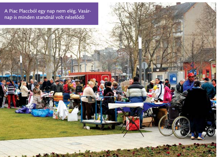
A Piac Placcból egy nap nem elég. Vasárnap is minden standnál volt nézelődő